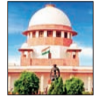
भारताचे सत्यन्यायाधीश सूर्य कांत यांच्या

◆ नवी दिल्ली, ८ एप्रिल धर्मातील कोणती प्रथा अंधश्रद्धा आहे, हे ठरवण्याचा अधिकार आणि अधिकारक्षेत्र न्यायालयाकडे आहे, असे निरीक्षण सर्वोच्च न्यायालयाने बुधवारी नोंदविले. केंद्राने केलेल्या युक्तिवादाला उत्तर देताना न्यायालयाने हे निरीक्षण नोंदविले. न्यायाधीश हे कायद्याचे तज्ज्ञ