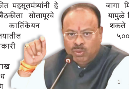
४३ कोटींच्या दंड १० लाखांवर कसा आला? मंत्र्यांकडून चौकशीचे आदेश

या प्रकरणातील धक्कादायक बाब म्हणजे, एका प्रकरणात ४३ कोटी रुपयांचा दंड निश्चित करण्यात आला असताना तो केवळ १० लाख रुपयांपर्यंत खाली आणला गेला. या संशयास्पद बाबीची सखोल चौकशी करण्याचे आदेश महसूलमंत्र्यांनी दिले आहेत. तसेच, या काळावधीत जे अधिकारी कार्यरत होते, त्यांची यादी सादर करून त्यांच्यावर कठोर कारवाई करण्याचे संकेत त्यांनी दिले आहेत.