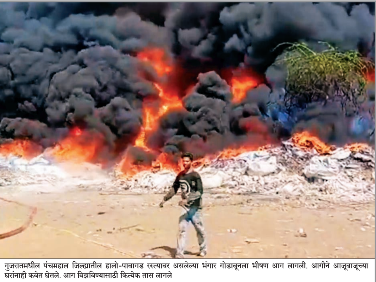
गुजरातमधील पंचमहाल जिल्ह्यातील हालो-पावागड रस्त्यावर असलेल्या भंगार गोडावूनला भीषण आग लागली. आगीने आजूबाजूच्या घरांनाही कवेत घेतले. आग विझविण्यासाठी कित्येक तास लागले