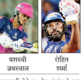
यशस्वी जयस्वाल रोहित शर्मा

◆ गुवाहाटी, ६ एप्रिल १९ व्या इंडियन प्रीमियर लीग हंगामात मंगळवारी येथील बरसापारा क्रिकेट स्टेडियमवर राजस्थान रॉयल्स व मुंबई इंडियन्स यांच्यात रोमांचक टी-२० सामना होणार आहे. एकीकडे अजिंक्य राजस्थान रॉयल्स आपल्या विजयाची लय कायम राखण्यास उत्सुक आहे, तर तिकडे पाच वेळा विजेता मुंबई इंडियन्स पुनरागमन करण्यास उत्सुक आहे, त्यामुळे यशस्वी जयस्वाल आणि रोहित शर्मा यांसारखे स्टार खेळाडूंचा कामगिरीवर सर्वांचे लक्ष असणार आहे.