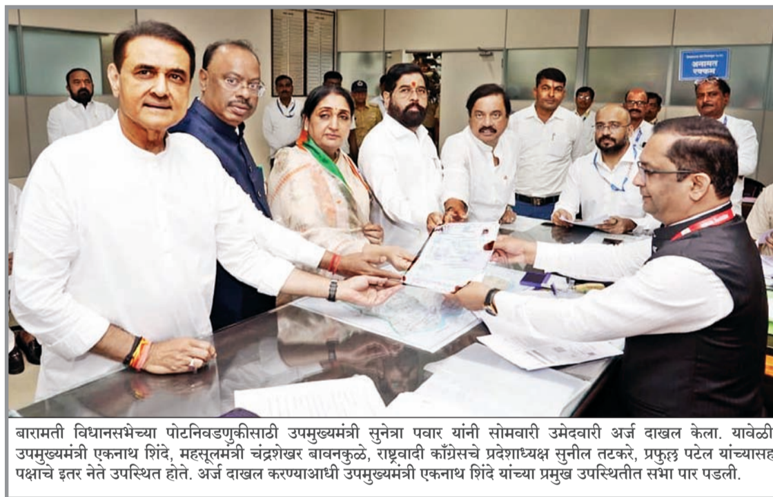
बारामती विधानसभेच्या पोटनिवडणुकीसाठी उपमुख्यमंत्री सुनेत्रा पवार यांनी सोमवारी उमेदवारी अर्ज दाखल केला. यावेळी उपमुख्यमंत्री एकनाथ शिंदे, महसूलमंत्री चंद्रशेखर बावनकुळे, राष्ट्रवादी काँग्रेसचे प्रदेशाध्यक्ष सुनील तटकरे, प्रफुल्ल पटेल यांच्यासह पक्षाचे इतर नेते उपस्थित होते. अर्ज दाखल करण्याआधी उपमुख्यमंत्री एकनाथ शिंदे यांच्या प्रमुख उपस्थितीत सभा पार पडली.