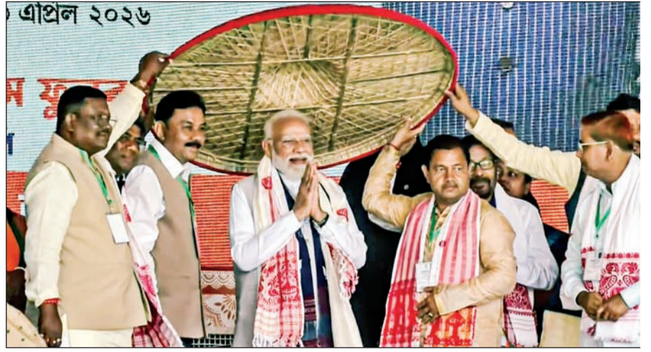
आसामच्या बारपेटा जिल्ह्यात आयोजित प्रचारसभेला संबोधित करण्यापूर्वी पंतप्रधान नरेंद्र मोदी यांचे पारंपरिक पद्धतीने स्वागत करण्यात आले