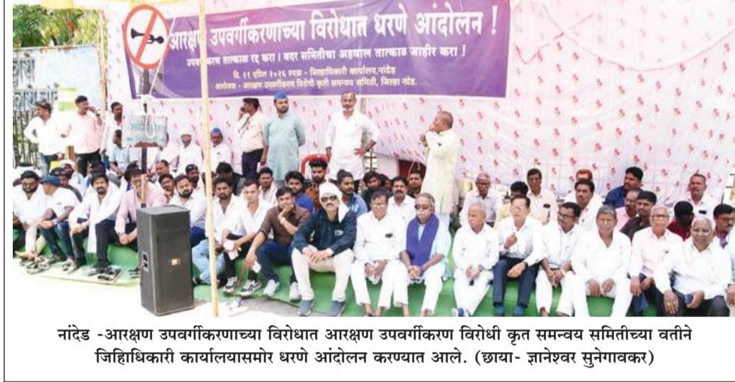
नांदेड -आरक्षण उपवर्गीकरणाच्या विरोधात आरक्षण उपवर्गीकरण विरोधी कृत समन्वय समितीच्या वतीने जिहाधिकारी कार्यालयासमोर धरणे आंदोलन करण्यात आले.

जल्मा कार्यालय - पहिला माला जनता मार्केट शिवाजीनगर नांदेड