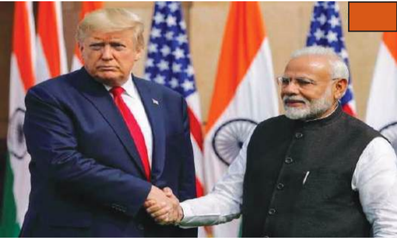
भारत- अमेरिका द्विपक्षीय व्यापार कराराशी विशेष भारतीय व्यापार प्रतिनिधीमंडळ संबंधित औपचारिकता पूर्ण करण्यासाठी याच आठवड्यात वॉशिंग्टन दौऱ्यावर जाणार आहे.

सर्जिओ गोर यांनी एका ट्विटद्वारे अधिकृत पुष्टी करत सांगितले की, भारतीय व्यापार प्रतिनिधीमंडळ या आठवड्यात वॉशिंग्टनला पोहोचत आहे. या महत्त्वाच्या दौऱ्याचा मुख्य उद्देश द्विपक्षीय व्यापार कराराला अंतिम स्वरूप देणे हा आहे.