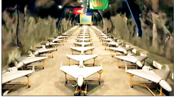
२८ फेब्रुवारीपासून सुरू झालेले युद्ध पावणे दोन महिने होऊनही सुरूच आहे. इराणने भुयारात सुरक्षित ठेवलेले आत्मघाती ड्रॉन्स

◆ वॉशिंग्टन, २२ एप्रिल इराणची लष्करी क्षमता मोठ्या प्रमाणात मजबूत आहे, असे जर्मनीसाठी क्षेपणास्त्र आणि ड्रोनचा मोठा साठा आणि लॉचर अगदी सुरक्षित असल्याचा दावा संरक्षण विभागाच्या (पेंटागॉन) अहवालातून करण्यात आला. या अहवालाने राष्ट्राध्यक्ष डॉनाल्ड ट्रम्प आणि संरक्षण मंत्री पीट हेगसेथ यांनी केलेले सर्व दावे फोत असल्याचे समोर आले आहे.