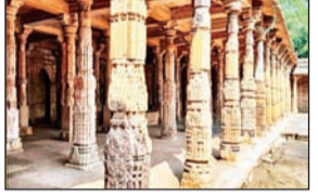
यांच्या खंडपीठासमोर सुनावणी सुरू आहे. हिंदू या वास्तूला वागदेवी किंवा देवी सरस्वतीचे मंदिर मानतात, तर मुस्लिम याला कमाल मौलाना मशीद म्हणतात. मौलाना कमालुद्दीन वेल्फेअर सोसायटीच्या वतीने बाजू मांडण्याचे ज्येष्ठ विधिज्ञ सलमान खुर्रशीद यांनी सर्वेक्षणाशी संबंधित व्हिडीओ चित्रीकरण सादर करण्याची मागणी करणाऱ्या याचिकेवर मंगळवारी आभासी स्वरूपात युक्तिवाद केला. पुरातत्त्व विभागाच्या अहवालावर आक्षेप हे व्हिडीओ चित्रीकरणवरून

◆ बंदूर, २२ एप्रिल भोजशाळा संकुलाच्या सर्वेक्षणाचे व्हिडीओ चित्रण संकेतस्थळावर अपलोड करा आणि मौलाना कमालुद्दीन वेल्फेअर सोसायटीसह इतर याचिकाकर्त्यांना ते पाहण्यासाठी सुविधा उपलब्ध करून द्या, असा निर्देश मध्यप्रदेश उच्च न्यायालयाने भारतीय पुरातत्त्व सर्वेक्षण विभागाला दिला आहे.