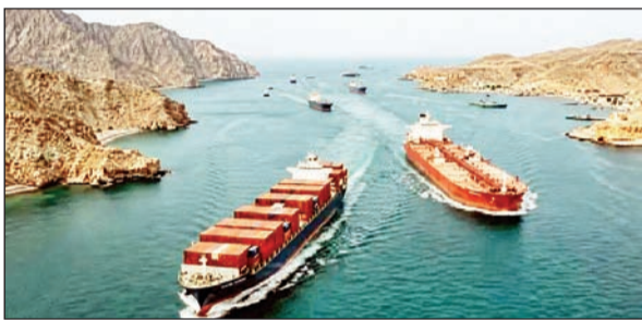
बैठकीचा मुख्य उद्देश होर्मुझमधून होणारी वाहतूक सुरक्षित करण्यासाठी ठोस लष्करी रणनीती तयार करणे हा आहे. यासंदर्भात बोलताना ब्रिटनचे संरक्षण मंत्री जॉन हीली म्हणाले, केवळ राजनैतिक सल्लमतीचे पुरेशी नाही, तर तिचे प्रत्यक्ष संयुक्त नियोजनात रूपांतर होणेही आवश्यक आहे. या बैठकीत लष्करी क्षमता, कमांड आणि कंट्रोल

◆ लंडन, २२ एप्रिल होर्मुझ सामुद्रधुनीचा वापर इराणकडून शस्त्रासारखे केला जात असून, यामुळे जहाजांची वाहतूक विस्कळीत झाली आहे. अमेरिकेची नाकाबंदी आणि इराणनेही हा मार्ग बंद केल्याने अनेक देश मोठ्या ऊर्जा संकटाचा सामना करताना दिसत आहेत. हा मार्ग आता पुन्हा सुरू करण्यासाठी ब्रिटन- फ्रान्सच्या नेतृत्वात ३० देश एकवटले आहे. लंडनमध्ये या देशांच्या लष्करी नियोजकांची महत्वाची बैठक होणार असून, यात होर्मुझमध्ये सैन्य तैनात करण्यावर चर्चा होणार आहे.