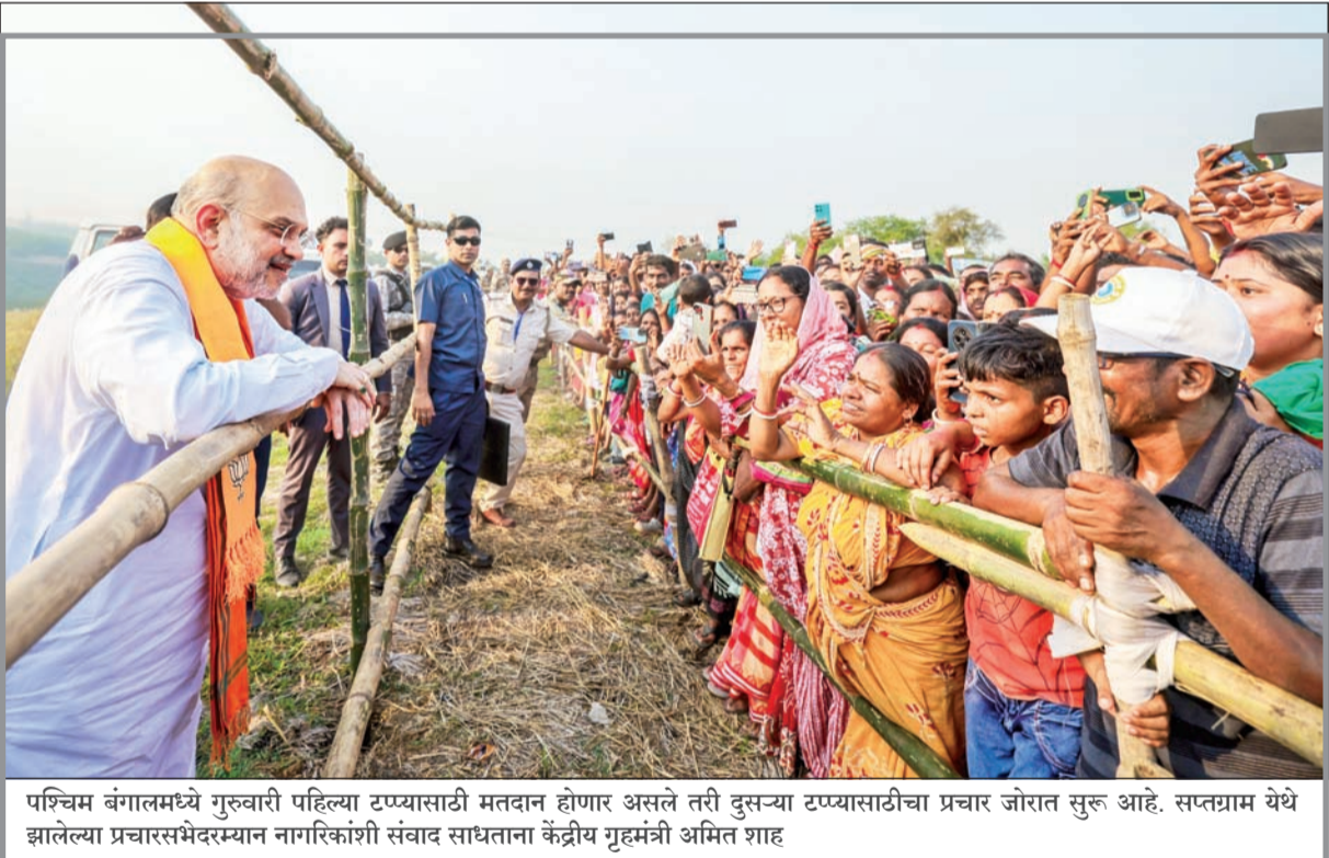
पश्चिम बंगालमध्ये गुरुवारी पहिल्या टप्प्यासाठी मतदान होणार असले तरी दुसऱ्या टप्प्यासाठीचा प्रचार जोरात सुरू आहे. सप्तग्राम येथे झालेल्या प्रचारसभेदरम्यान नागरिकांशी संवाद साधताना केंद्रीय गुह्यमंत्री अमित शहा