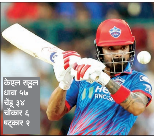
केएल राहुल धावा ५७ चेंडू ३४ चौकार ६ षटकार २

बंगळूर, १८ एप्रिल शनिवारी एम. चिन्नास्वामी स्टेडियमवर इंडियन प्रीमियर लीग क्रिकेट सामन्यात केएल राहुल (५७) व ट्रिस्टन स्टब्सचा (५०) अर्धशतकी खेळीच्या बळावर दिल्ली कॅपिटल्सने रॉयल चॅलेंजर्स बंगळूरवर (आरसीबी) एक चेंडू शिल्लक ठेवित ६ गड्यांनी विजय मिळविला. दिल्लीचा हा पाच सामन्यातील तिसरा विजय असून त्यांनी ६ गुणांसह गुजरातला मागे टाकत चौथे स्थान मिळविले. आरसीबीचा हा सहा सामन्यातील दुसरा पराभव असून ते ८ गुणांसह दुसऱ्या स्थानावर कायम आहे.