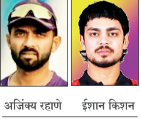
अजिंक्य रहाणे ईशान किशन

कोलकाता, १८ एप्रिल दुखापतग्रस्त राजस्थान रॉयल्स जोरदार पुनरागमन करून संघर्ष करणाऱ्या कोलकाता नाईट रायडर्सचे दुःख अधिक वाढवण्याचा प्रयत्न करेल. रविवारी दुपारी कोलकाता येथील इंडिअन गार्डन्सवर होणाऱ्या आयपीएल सामन्यात, भिन्न कामगिरी करणारे हे दोन संघ आमने-सामने उभे ठाकणार आहे.