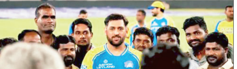
मैदानावर ग्राऊंडमनसोबत छायाचित्र काढता महेंद्रसिंह धोनी

हैदराबाद, १८ एप्रिल चेन्नई सुपर किंग्साचा (सीएसके) अनुभवी खेळाडू एम.एस. धोनीने पुन्हा एकदा मैदानाबाहेर आपल्या एका हृदयस्पर्शी कृतीने सर्वांची मने जिंकली आहे. शनिवारी सनरायझर्स हैदराबादविरुद्धच्या आयपीएल सामन्यापूर्वी, राजीव गांधी आंतरराष्ट्रीय क्रिकेट स्टेडियमवर धोनी ग्राऊंड स्टाफशी