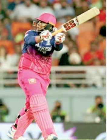
शर्मा (३८० धावा), दिल्ली कॅंपिटल्सचा केएल राहुल (३५८ धावा), रॉयल चॅलेंजर्स बंगळूरुचा विराट कोहली (३५९ धावा) आणि हैदराबादचा हेनरिक क्लासेन (३४९ धावा) यांचा समावेश

◆ नवी दिल्ली, २९ एप्रिल राजस्थान रॉयल्सचा युवा फलंदाज वैभव सूर्यवंशी या आयपीएल हंगामात सर्वाधिक धावा करणाऱ्या फलंदाजांच्या यादीत पुन्हा एकदा अव्वल स्थानी पोहोचला आहे. सूर्यवंशीने १६ चेंडूत पाच चौकारांसह ४३ धावांची धडाकेबाज खेळी केली. या खेळीसह तो या हंगामात ४०० धावांचा टप्पा गाठणारा पहिलाच फलंदाज ठरला आहे.