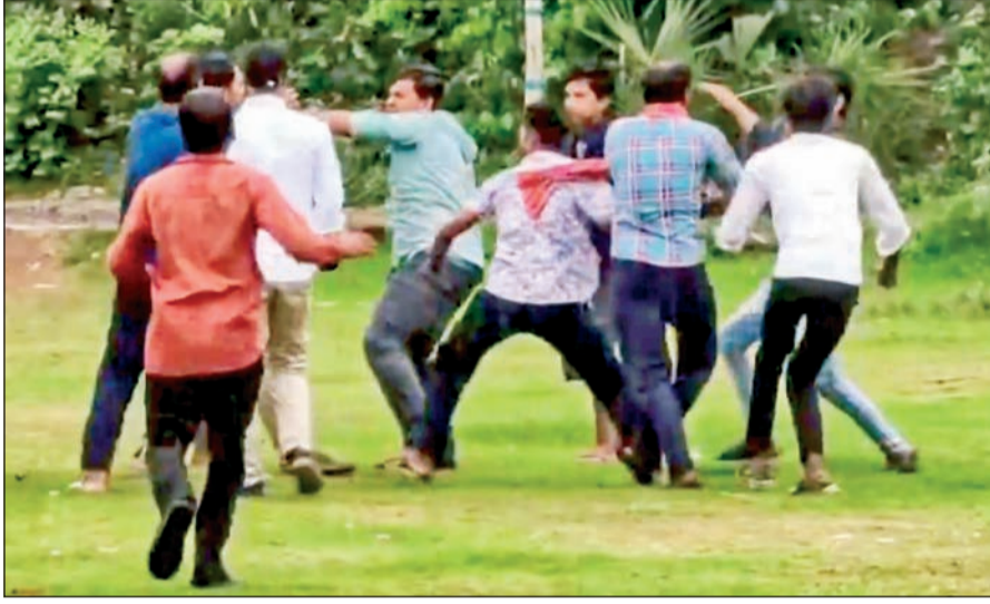
हुबळी जिल्ह्यातील रामचंद्रपूर मतदान संधातील एका केंद्रावर तृणमूल काँग्रेस आणि आयएसएफ समर्थकांमध्ये अशी हाणामारी झाली