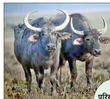
परिसंस्थेसाठी नवा टप्पा