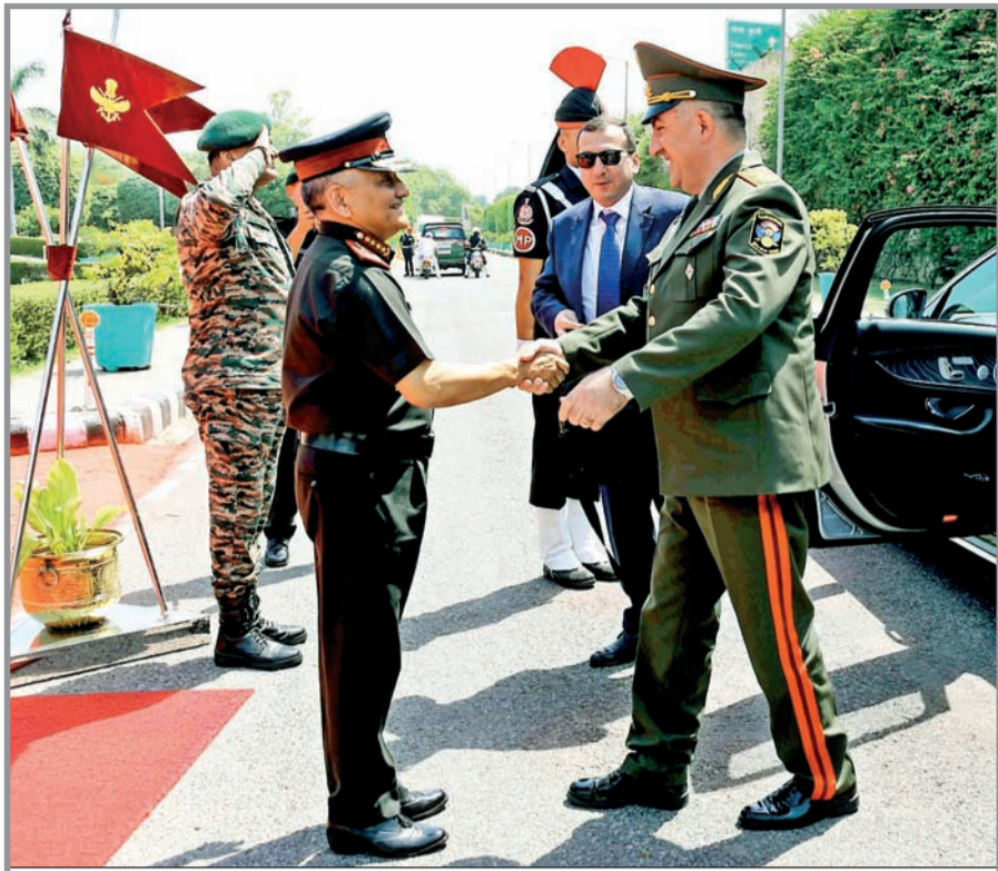
आर्मेनियाचे लष्करप्रमुख लेफ्टनंट जनरल एडवर्ड अर्यान भारताच्या भेटीवर आले आहेत. त्यांचे स्वागत करताना सीडीएस अनिल चौहान