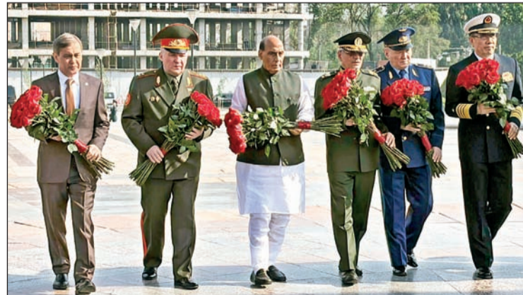
संरक्षणमंत्री राजनाथसिंह किर्गिस्तानच्या दौऱ्यावर आहेत. मंगळवारी त्यांनी विश्वकेक शहरातील विजय चौकात हुतात्म्यांना श्रद्धांजली दिली

देगान्यांविरुद्ध योग्य ती कारवाई करण्यास एस्सीओने मान्यते बघू नये, असे सिंह म्हणाले. दहशतवादाचा मुकाबला करण्यासाठी एकत्रित जागतिक प्रयत्न आवश्यक आहेत, असे राजनाथसिंह यांनी जोरकसपणे सांगितले.