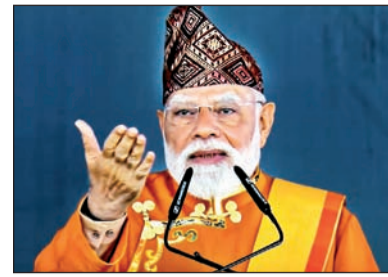
पंतप्रधान नरेंद्र मोदी यांचे प्रतिपादन

राज्यासाठी रोप-वे आणि स्क्या-वे प्रकल्प विचाराधीन आहेत, तर पर्यटकांचा ओघ वाढवा या उद्देशाने नाथू-ला येथे एक द्रुतगतीमार्ग