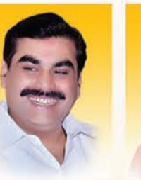
मा. जयवंतराव जंगताप मा. आमदार, कामठा विधानसभा