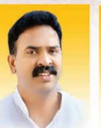
मा. राजजितसिंह निंबाळकर मा. खासदार, मादा नोकसभा