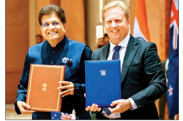
पीयूष गोयल आणि न्यूझीलंडचे मंत्री टॉड मॅक्ले यांनी व्यापार करारावर स्वाक्षरी केली

या कराराचा उद्देश द्विपक्षीय व्यापार दुप्पट करणे, भारतीय निर्यातदारांना न्यूझीलंडच्या बाजारपेठेत शुल्कमुक्त प्रवेश देणे आणि पुढील १५ वर्षात २० अब्ज डॉलर्सची गुंतवणूक आकर्षित करणे हा आहे. दोन्ही देशांमधील व्यापार आणि गुंतवणुकीवर परिणाम करू शकणारे इतर अडथळे कमी करणे हा देखील या कराराचा उद्देश असल्याचे गोयल यांनी सांगितले. या करारामुळे न्यूझीलंडमध्ये निर्यात करण्यात येणाऱ्या भारतीय उत्पादनाला कुठेतही शुल्क लागणार नाही. यामुळे