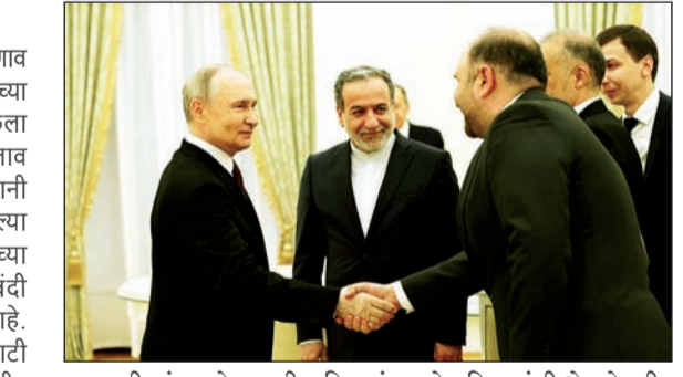
अराघची यांच्या नेतृत्वातील शिष्टमंडळाने पुतिन यांची भेट घेतली

◆ तेहरान, २७ एप्रिल मध्यपूर्वेतील सध्याचा तणाव आणि खडबडलेल्या शांतता चर्चेच्या पृष्ठभूमीवर इराणने अमेरिकेला आपला क्रमांक आणि आवश्यक माहिती तयार ठेवणे गरजेचे आहे. निकाल पाहण्यासाठी अधिकृत संकेतस्थळावर जाऊन आवश्यक माहिती भरल्यानंतर गुणपत्रिका पाहता आणि डाउनलोड करता येईल. डिजिटल लॉकरसारख्या सुविधांमधूनही निकाल सहज उपलब्ध होणार आहे. निकालात विद्यार्थ्यांचे विषयानुसार गुण, एकूण टक्केवारी आणि उत्तीर्ण झाल्याची स्थिती यासारखी माहिती मिळणार आहे. निकाल जाहीर होताच अधिकृत संकेतस्थळावर गर्दी होण्याची शक्यता असून, विद्यार्थ्यांनी संयम ठेवून निकाल तपासण्याचे आवाहन करण्यात आले आहे.