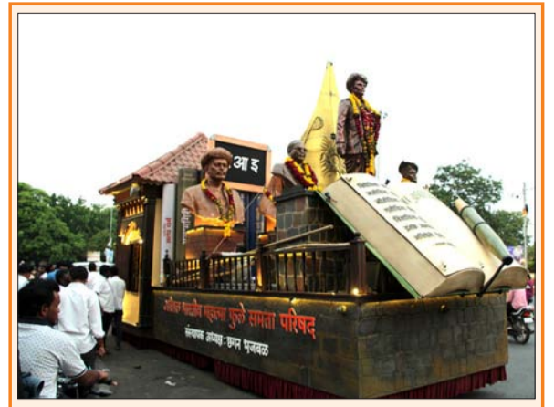
सोलापूर : अखिल भारतीय महात्मा फुले समता परिषदेचा भिडे वाडा चित्रथ सोलापुरात रविवारी सायंकाळी दाखल झाला.