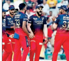
नवी दिल्ली, २६ एप्रिल

२६४ धावा करूनही झालेल्या मोठ्या पराभवामुळे दुखावलेल्या दिल्ली कॅपिटल्सकडे भावनिकदृष्ट्या सावरण्यासाठी फार कमी वेळ आहे, कारण सोमवारी नवी दिल्लीत होणाऱ्या आयपीएल सामन्यात त्यांचा सामना गतविजेत्या रॉयल चॅलेंजर्स बंगळुरू या आणखी एका बलाढ्य संघाशी होणार आहे. पंजाब किंग्सकडून सहा गडी राखून झालेल्या पराभवामुळे दिल्ली कॅपिटल्स हादरली आहे. या सामन्यात विक्रमी धावसंख्येचा पाठलाग करताना त्यांच्या गोलंदाजांची धुलाई झाली. गुणतालिकेत सहाव्या स्थानावर असलेला हा संघ आता प्ले-ऑफच्या चुरशीच्या शर्यतीत अडकला आहे, जिथे आणखी एक पराभव त्यांच्या संधींना गंभीर धक्का देऊ शकतो.