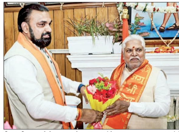
बिहार विधानसभेचे अध्यक्ष प्रेम कुमार यांचे स्वागत करताना मुख्यमंत्री सम्राट चौधरी

दरम्यान, २५ ते ३० पुन्हा नितीश, असे म्हणत भाजपाने नितीश कुमाराना संपवले, असा आरोप करत तेजस्वी यादव यांनी प्रस्तावाला विरोध केला. यावर उत्तर देताना मुख्यमंत्री सम्राट चौधरी म्हणाले, नितीश कुमाराना कोणीही हटवू शकत नाही. मी आज त्यांच्याच इच्छाशीतुळे मुख्यमंत्री झालो आहे. तेजस्वीवर निशाणा साधत सम्राट चौधरी म्हणाले,