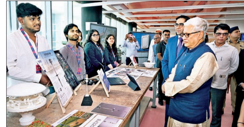
विद्यार्थ्यांशी संवाद साधताना राज्यपाल

कोणतेही तंत्रज्ञान उपलब्ध असणे आणि त्याचे ठोस उद्दिष्ट नसणे हे धोक्याचे असते. तसेच, विज्ञानाला जर मानवी मूल्यांची जोड नसेल, तर ते प्रगतीऐवजी विनाशच ओढवू शकते. पंतप्रधान नरेंद्र मोदी यांनी दिलेल्या जय अनुसंधानच्या मंत्राचा उल्लेख करत राज्यपाल म्हणाले की, सध्याचे युग हे विज्ञान आणि नवोन्मेषाचे आहे, परंतु हे संशोधन करताना सर्वसामान्यांच्या हिताचा आणि समाजाच्या शोबट्याचा घटक विचार होणे