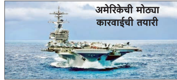
अमेरिकेची मोठ्या कारवाईची तयारी