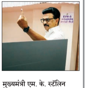
मुख्यमंत्री एम. के. स्टॅलिन