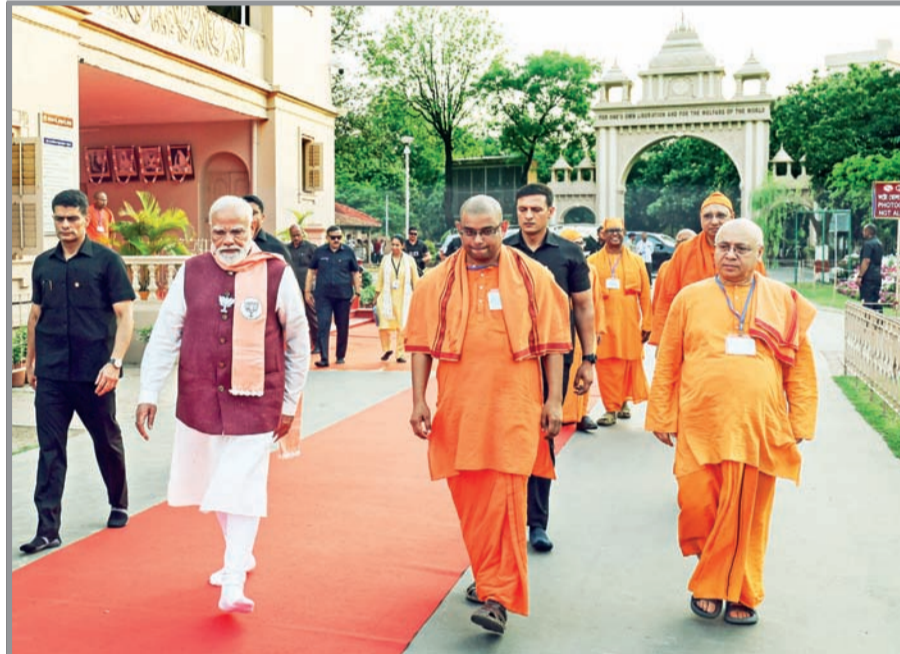
पश्चिम बंगालमध्ये पंतप्रधान नरेंद्र मोदींचा सभाका धडाका सुरू आहे. सभा संपल्यानंतर मोदींनी गुरुवारी हावडा येथील बेलूर मठाला भेट दिली