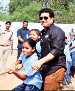
तेंडुलकरचा दौरा बस्तरमधील परिवर्तनाचे प्रतीक