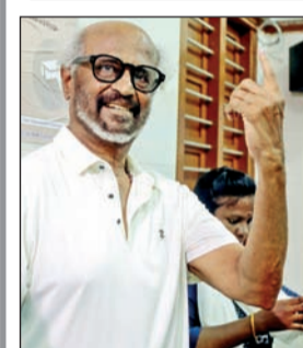
चेन्नई येथील विविध मतदान केंद्रांवर अभिनेते रजनीकांत, कमल हसन, श्रुति हसन, थलपती विजय यांनी मतदानाचा हक्क बजावला