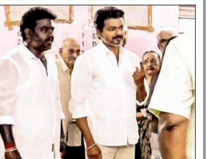
तमिळनाडूतील एका केंद्रावर मतदानासाठी लागलेली रांग