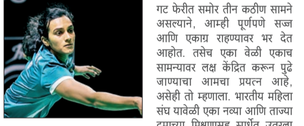
पी. व्ही. सिंधू

सुरुवातीच्या टप्प्यातच एका आह्वानात्मक वेळापत्रकाचा सामना करावा लागणार आहे. पुरुष संघ आपला पुढील सामना २७ एप्रिल रोजी (दुपारी १२ वाजता) ऑस्ट्रेलियाविरुद्ध खेळेल व त्यानंतर २९ एप्रिल रोजी (दुपारी १.३० वाजता) चीनविरुद्ध एका अत्यंत महत्त्वाच्या आणि अटीतटीच्या लढतीसाठी सज्ज होईल. दुसरीकडे, महिला संघ आपली मोहीम