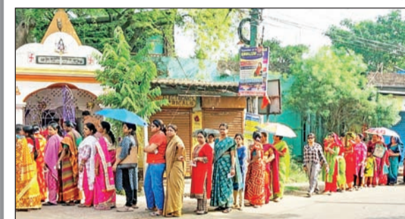
पश्चिम बंगालमधील मिदनापूर येथील केंद्रावर मतदानासाठी लागलेली महिलांची रांग