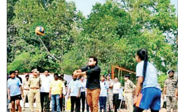
आपल्या संदेशात म्हटले आहे. सचिन तेंडुलकर फाऊंडेशन आणि मानदेयी फाऊंडेशन यांच्या संयुक्त विद्यमाने आयोजित करण्यात आलेली मैदान कप मोहीम हे क्रीडा पायाभूत सुविधांच्या विशेषतः आदिवासी भागांमधील बाबतीत एक दूरदृष्टीपूर्ण पाऊल असून, ती सर्वांगीण विकासाला हातभार लावणारी आहे, असेही ते म्हणाले.