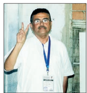
मतदानानंतर विजयी खून दाखविताना भाजपाचे शुभेंद्र अधिकारी