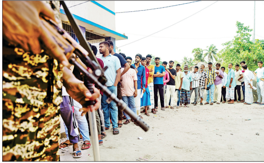
नंदीग्राम येथील मतदान केंद्रावर मतदारांची झालेली ही गर्दी. येथे चोख सुरक्षा ठेवण्यात आली होती