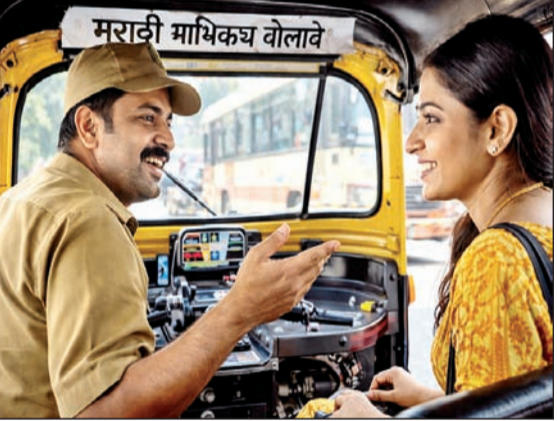
मराठी माधिक्य वोलवे सरसि उल्लंघन केले जात आहे, असा इशारा सरनाईक यांनी दिला. चालक प्रवाशांसोबत मराठीत संपर्क साधण्यात अपयशी ठरत आहेत किंवा टाळाटाळ करीत आहेत याचा असंख्य तक्रारी

मराठीचे पुरेसे ज्ञान नसलेल्या चालकांचे परवाने रद्द केले जातील, असा इशारा सरनाईक यांनी दिला आहे. १ मे म्हणजेच महाराष्ट्र दिनापासून परवानाधारक रिक्षा आणि टॅक्सी चालकांसाठी मराठी भाषेचे ज्ञान अनिवार्य असेल. चालकांना मराठी भाषा लिहिता अथवा वाचता