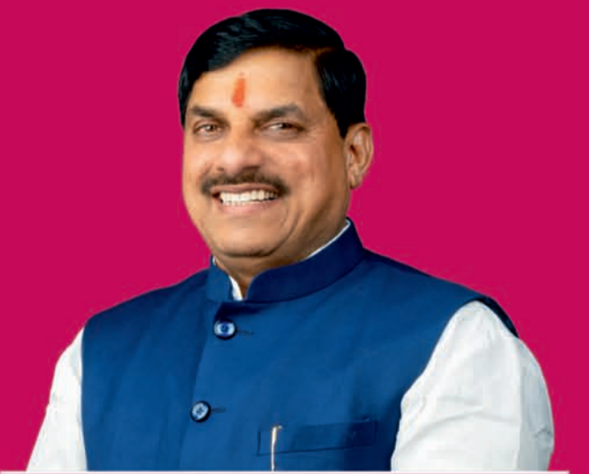
डॉ. मोहन यादव मुख्यमंत्री, मध्यप्रदेश