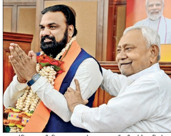
मुख्यमंत्रिपदासाठी निवड झाल्यानंतर सम्राट चौधरी यांचे अभिन्नंदन करताना जदयूचे प्रमुख नितीशकुमार