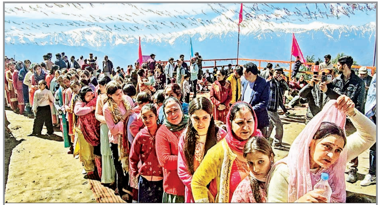
जम्मू-काश्मीरमधील भदरवाह येथील प्राचीन सुबार नाग पर्वतावरील नाग बैसाखी यात्रेला सुरुवात झाली आहे. वसंत ऋतूच्या आगमनाची चाहूल म्हणूनही या उत्सवाकडे पाहिले जाते

बसमध्ये एकूण १३ वऱ्हाडी होते. इतर लोक दुसऱ्या गाड्यांमधून मागे येत होते. लमनंतर परत येत असताना बस रस्त्याच्या कडेला उभी होती. रस्ता खूप अरुंद होता.