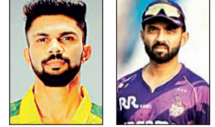
धोनीच्या पुनरागमनाचे संकेत

◆ चेन्नई, १३ एप्रिल इंडियन प्रीमियर लीगच्या १९ व्या हंगामात मंगळवारी एम. ए. विदम्बरम स्टेडियमवर चेन्नई सुपर किंग्स (सीएसके) व कोलकाता नाईट रायडर्स (केकेआर) यांच्यादरम्यान साखळी सामना खेळला जाणार आहे. गत सामन्यातील अत्यंत आवश्यक विजयातून मिळालेला आत्मविश्वास कायम ठेवण्याचा सीएसकेचा प्रयत्न असेल. दिल्ली कॅपिटल्सविरुद्धच्या अष्टपैलू कामगिरीच्या जोरावर सीएसकेने या हंगामातील आपला पहिला विजय नोंदविला. या सामन्यात सूर गवसलेल्या संजू सॅमसनने ५६ चेंडूत ११५ धावांची शानदार शतकाचा व उत्कृष्ट गोलंदाजीचा समावेश होता. पुन्हा तंदुरुस्त झालेल्या डेवावड ब्रेविसमुळे सीएसकेला आपल्या गोलंदाजीच्या संयोजनात बदल करण्याची संधी मिळाली. त्यामुळे संचाला दिल्ली कॅपिटल्सविरुद्ध २१२ धावांचा बचाव करणे शक्य झाले. सॅमसनने केली वचनपूर्तता डावखुरा वेगवान गोलंदाज गुर्जपनीत सिंगने आपल्या आयपीएल पदार्पणात सर्वांना प्रभावित केले. जेमी ओल्डर्टनेही उत्कृष्ट कामगिरी केली व चार बळी मिळविले. डावखुरा फिरकी गोलंदाज अकील होसेनने पॉवरप्लेमध्ये गोलंदाजीला एक नवीन आयाम दिला. फलंदाजीत सॅमसनने