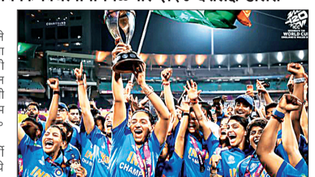
विश्वचषक विजेत्या भारतीय महिला क्रिकेटपटू

◆ दुबई, १३ एप्रिल आंतरराष्ट्रीय क्रिकेट परिषदेने (आयसीसी) २०२६ च्या महिला टी-२० विश्वचषकासाठी ८,७६,४,६१५ अमेरिकन डॉलर्सच्या विक्रमी बक्षीस निधीची घोषणा केली आहे. ही रक्कम २०२४ च्या स्पर्धेच्या तुलनेत १० टक्क्यांनी अधिक आहे. ही रक्कम दोन वर्षांपूर्वी संयुक्त अरब अमिरातमध्ये झालेल्या स्पर्धेत सहभागी १० देशांमध्ये वाटपण्यात आलेल्या ७,९५,८,७७७ डॉलर्सपेक्षा जास्त आहे; याचे मुख्य कारण म्हणजे, ही स्पर्धा प्रथमच १२ संघांपर्यंत