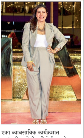
एका व्यावसायिक कार्यक्रमात सहभागी झालेली अभिनेत्री काजोल

मुख्यमंत्रिपद काँग्रेसचे सर्वाधिक म्हणजे चार वेळा तर भाकपचे ई.के. नायनर आणि काँग्रेसचे के. अण्टोनी यांनी तीन वेळा केरळचे मुख्यमंत्रिपद भूषवले. गंगत म्हणजे करुणाकरन यांचा मुख्यमंत्रिपदाचा पहिला कार्यकाळ फक्त एक महिन्यांचा होता. २५ मार्च १९७७ ते २५ एप्रिल १९७७ असे एक महिना करुणाकरन् मुख्यमंत्री होते. २८ डिसेंबर १९८१ रोजी करुणाकरन् दुसऱ्यांदा मुख्यमंत्री झाले. मुख्यमंत्रिपदाचा त्यांचा दुसरा कार्यकाळही फक्त तीन महिन्यांचा होता. २४ मे १९८२ रोजी करुणाकरन तिसऱ्यांदा केरळचे मुख्यमंत्री झाले. यावेळी मात्र त्यांनी मुख्यमंत्रिपदाचा पाच वर्षांचा कार्यकाळ पूर्ण केला. भाकपचे ई.के. नायनर यांच्यानंतर करुणाकरन मुख्यमंत्री झाले होते. २५ जानेवारी १९८० ते २० ऑक्टोबर १९८१ या काळात नायनर मुख्यमंत्री होते. करुणाकरन मुख्यमंत्रिपदावरून