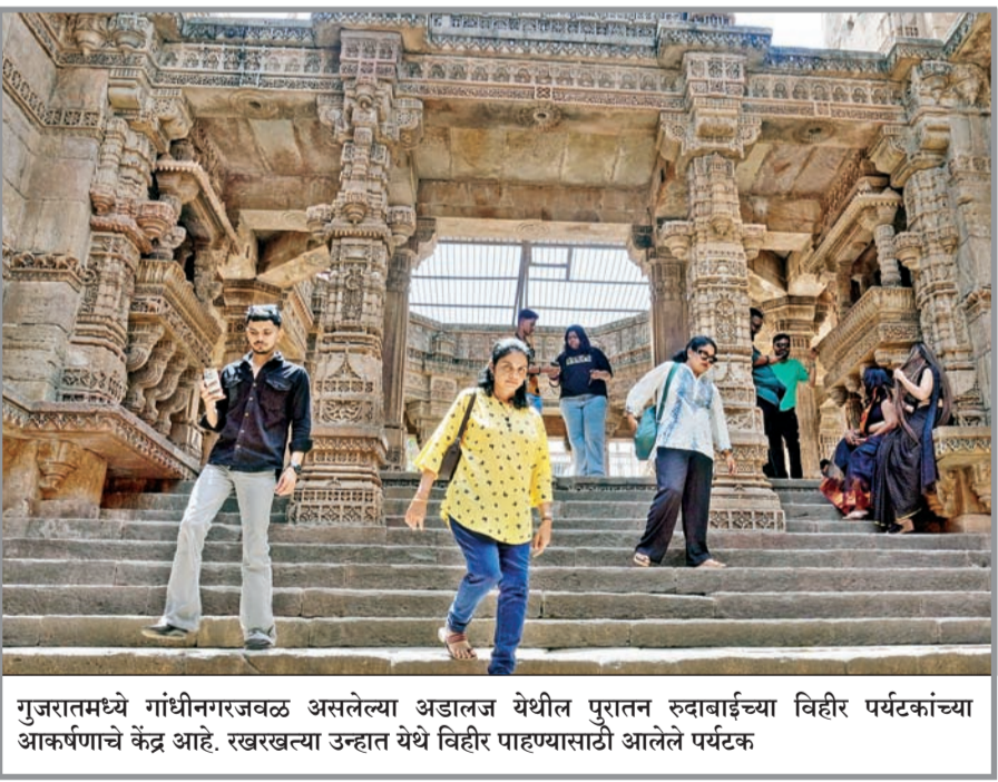
गुजरातमध्ये गांधीनगरजवळ असलेल्या अडालज येथील पुरातन रुवावाईच्या विहीर पर्यटकांच्या आकर्षणाचे केंद्र आहे. रखरखल्या उन्हात येथे विहीर पाहण्यासाठी आलेले पर्यटक

कर्जाची मुदत वाढवून देत असे. यावेळी डिसेंबर २०२५ मध्ये केवळ दोन महिन्यांची मुदतवाढ देण्यात आली. याची अंतिम मुदत १७ एप्रिल रोजी संपत आहे. मात्र, मुदतीपूर्वी कर्जाची रक्कम परत करावी असा निर्देश यूएईने पाकिस्तानला दिले. कर्जाची रक्कम परत केल्यामुळे पाकिस्तानच्या गंगाजळीत मोठी घट होईल. चालू आर्थिक वर्षात पाकिस्तानला सौदी अरबला पाच अब्ज डॉलर्स, चीनचे चार अब्ज डॉलर्सचे कर्ज परत करावेचे आहे. (वृत्तसंस्था)