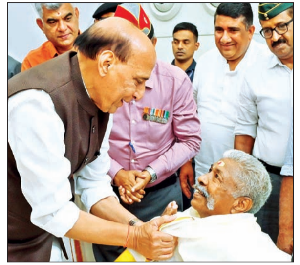
माजी सैनिकाचा सत्कार करताना संरक्षणमंत्री राजनाथसिंह

◆ तिरुअनंतपुरम, २ एप्रिल देशात इंधन किंवा वायूची कोणतीही कमतरता नाही. भारत कोणत्याही ऊर्जा संकटावर मात करण्यासाठी सज्ज आहे, अशी स्पष्टोक्ती संरक्षण मंत्री राजनाथसिंह यांनी गुरुवारी केली. ते केरळमधील प्रचारसभेला संबोधित करीत होते. तेल आणि वायू घेऊन येणाऱ्या टॅकरला भारतीय नौदलाच्या युद्धनौका सुरक्षितपणे होर्मुझच्या सामुद्रधुनीतून बाहेर काढत आहेत. देशाच्या हितरक्षणासाठी पंतप्रधान नरेंद्र मोदी कूटनीतीचा अत्यंत प्रभावी वापर करीत आहेत, असे राजनाथसिंह यांनी सांगितले.