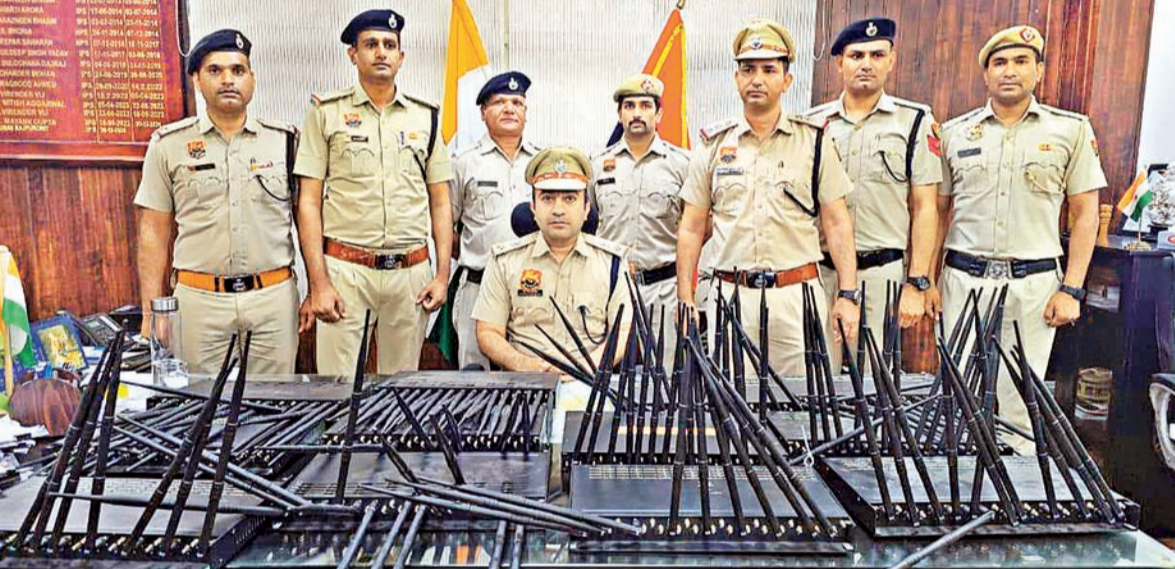
फिलिपिन्स आणि कंबोडियाशी संबंध असलेल्या एका सायबर फसवणूक रॅकेटचा पर्दाफाश केल्यानंतर आणि बेकायदेशीर सिम बॉक्स वापरणे तसेच त्याची वाहतूक केल्याप्रकरणी पाच जणांना अटक केल्यानंतर गुरुग्राम येथे बुधवारी पोलिस अधिकाऱ्यांनी जप्त केलेले राऊटर्स प्रदर्शित केले

शक्तिपीठ महामार्गामुळे राज्यातील प्रमुख धार्मिक स्थळे एकमेकांना जोडली जाणार आहेत. सुधारित मार्गामुळे आता माहूर, तुळजापूर आणि कोल्हापूर या तीन शक्तिपीठांसह औंदा नागनाथ, परळी वैद्यनाथ, पंढरपूर, नरसोबाची वाडी आणि ज्योतिबा अशा २१ पवित्र स्थळांना भाविक अत्यंत कमी वेळात भेट देऊ शकतील. कोल्हापूर आणि सिंधुदुर्ग अशा १३ जिल्ह्यांतील ४० तालुक्यांचा समावेश आहे. ◀(तथा वृत्तसेवा)