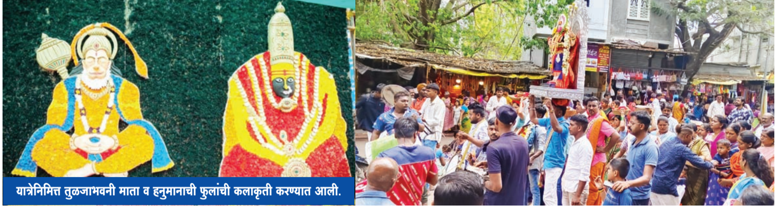
यात्रेनिमित्त तुळजाभवनी माता व हनुमानाची फुलांची कलाकृती करण्यात आली.

सोलापूर तरुण भारत, सोलापूर, (महाराष्ट्र) येथून प्रकाशित केले. आवृत्ती सातारा, संभाजीनगर, धाराशिव, लातूर, नांदेड, परभणी, हिंगोली, जालना व बीड (महाराष्ट्र), तसेच विजयपूर, कलबुर्गी, बीदर (कर्नाटक) येथून प्रकाशित केले.