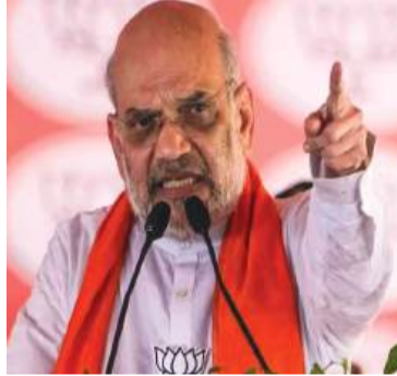
परिसरातून सुरु होऊन थिरून चित्रमलाई यांच्या पुतळ्याजवळ संपला. अमित शाह यांनी