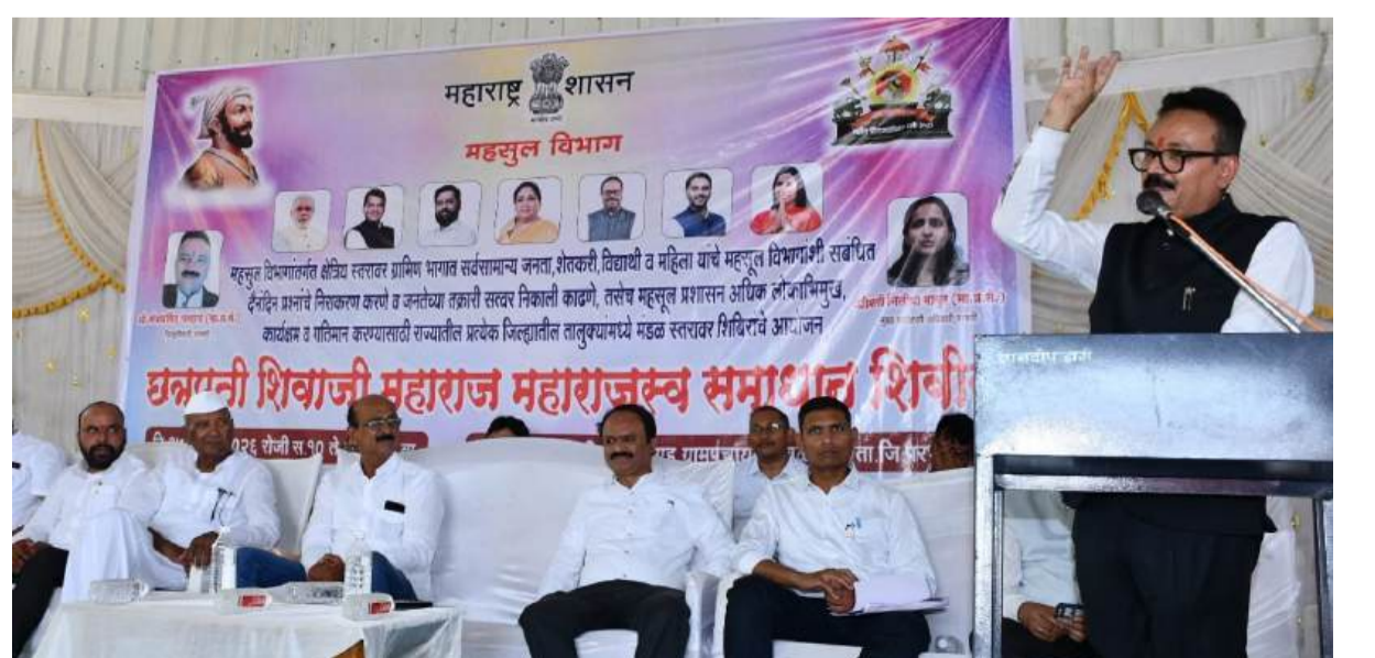
संख्येने उपस्थित राहून विविध या शिबिरामुळे ग्रामीण शासकीय सेवांचा समाधान व्यक्त करण्यात

जिल्हाधिकारी यांच्या हस्ते लाभाभ्यांना प्रतिनिधिक स्वरूपात प्रमाणपत्रांचे वितरण करण्यात आले. यामध्ये निराधार व दिव्यांग महिलांना सामाजिक अर्थसहाय्य योजनांचा लाभ देण्यात आला. तसेच विद्यार्थ्यांना आवश्यक असलेली जात व उत्पन्न प्रमाणपत्रे, मोहिमेअंतर्गत फरफार नक्कल व दुरुस्त सातबारा उतारे वितरित करण्यात आले. आरोग्य विभागामार्फत नागरिकांची प्राथमिक आरोग्य तपासणी करण्यात आली, तर विविध योजनांसाठी इच्छुक नागरिकांकडून अर्जही स्वीकारण्यात आले. झरीसह साडेगाव, वाडीदमई, संबंर, मटकराळा आदी गावांतील