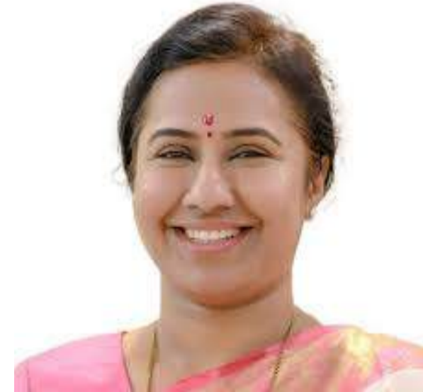
आढळल्यास तात्काळ गुन्हा देण्यात आले आहेत. दाखल करण्याचे स्पष्ट निर्देश जिल्हाधिकारी यांच्या

राज्यातील सर्व सरपंच, पोलीस पाटील, ग्रामसेवक आणि अंगणवाडी सेविका यांना गावांमध्ये होणाऱ्या विवाहापूर्वी मुलगा व मुलगी यांच्या वयाची खात्री करण्याचे आदेश देण्यात आले आहेत. विशेषतः अक्षय तृतीयेच्या दिवशी होणाऱ्या विवाह सोहळ्यांवर लक्ष ठेवून बालविवाह होणार नाही यासाठी पोलीस विभाग व स्थानिक प्रशासनाला समन्वयाने काम करण्यास सांगितले आहे. तालुका व ग्रामस्तारावर विशेष पथके स्थापन करून देवस्थान, मंगल कार्यालये आणि इतर विवाहस्थळांची प्रत्यक्ष पाहणी करण्यात येणार आहे. बालविवाहाचे कोणतेही प्रकरण