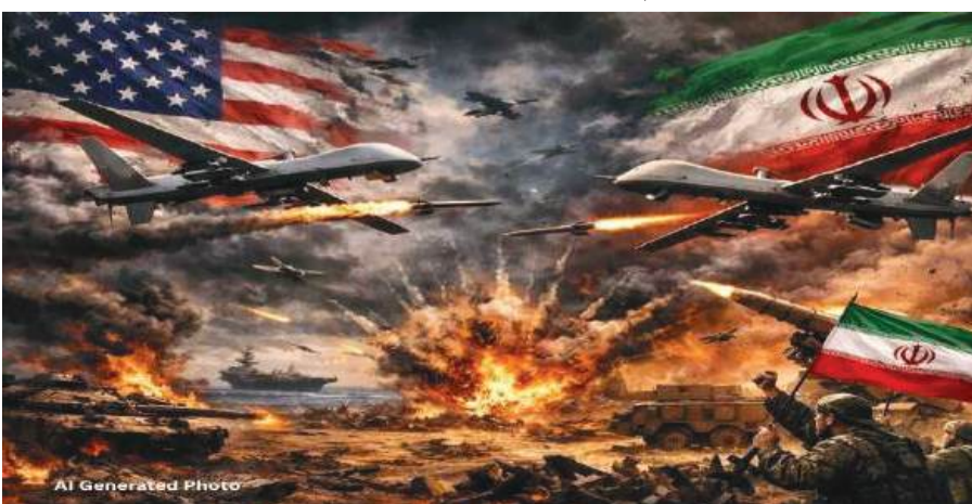
सारख्या आधुनिक फायटर जेटला लक्ष्य करणे म्हणजे संरक्षण तंत्रज्ञानाच्या क्षेत्रात

तेहरान : इराणने पुन्हा एकदा आपल्या लष्करी क्षमतेबाबत मोठा दावा केला आहे. इराणी संसदेचे अध्यक्ष मोहम्मद बाकर गालिबाफ यांनी सांगितले की, त्यांच्या दलांनी सुमारे १८० ड्रोन निष्क्रिय केले असून अमेरिकेच्या एफ-३५ स्टेल्थ फायटर जेटलाही लक्ष्य केले. ही एख-ादी एकदाच घडलेली घटना नसून, इराणच्या तांत्रिक आणि रणनीतिक क्षमतेचे उदाहरण असल्याचे त्यांनी म्हटले. इराणच्या वृत्तसंस्थेनुसार, गालिबाफ यांनी वॉशिंग्टनसोबत सुरु असलेल्या अप्रत्यक्ष चर्चेच्या सध्याच्या स्थितीबाबत अधिकाऱ्यांना माहिती देताना हे वक्तव्य केले. गालिबाफ म्हणाले की, एफ-३५