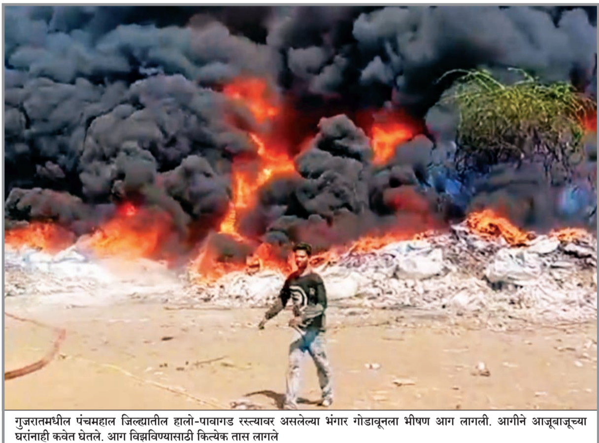
गुजरातमधील पंचमहाल जिल्ह्यातील हालो-पावागड रस्त्यावर असलेल्या भंगार गोडावूनला भीषण आग लागली. आगीने आजूबाजूच्या घरांनाही कवेत घेतले. आग विझविण्यासाठी कित्येक तास लागले