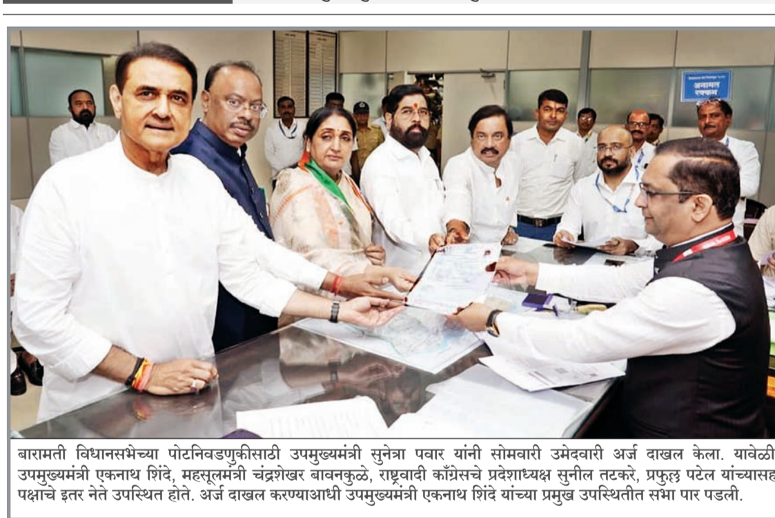
बारामती विधानसभेच्या पोटनिवडणुकीसाठी उपमुख्यमंत्री सुनेत्रा पवार यांनी सोमवारी उमेदवारी अर्ज दाखल केला. यावेळी उपमुख्यमंत्री एकनाथ शिंदे, महसूलमंत्री चंद्रशेखर बावनकुळे, राष्ट्रवादी काँग्रेसचे प्रदेशाध्यक्ष सुनील तटकरे, प्रफुल्ल पटेल यांच्यासह पक्षाचे इतर नेते उपस्थित होते. अर्ज दाखल करण्याआधी उपमुख्यमंत्री एकनाथ शिंदे यांच्या प्रमुख उपस्थितीत सभा पार पडली.

वाढविणे या योजनेअंतर्गत राज्यातील सर्व कारागृहांमध्ये "वाटर कूलर विद्युत्प्रीफायर" खरेदीस प्रशासकीय मान्यता देण्यात आली आहे. कैद्यांना दिल्या जाणाऱ्या पाण्याच्या गुणवत्तेबाबतची याचिका मुंबई उच्च न्यायालयात दाखल झाली होती. यात कैद्यांना देण्यात येणारे पाणी धूळ व गाळयुक्त बादलीत साठवले जाते आणि तेच पाणी इतर कामांसह पिण्यासाठीही वापरले जात असल्याचे स्पष्ट झाले होते.