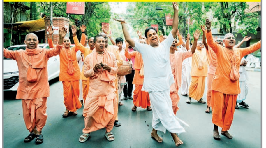
पश्चिम बंगालमध्ये दुसऱ्या टप्प्यातही २९-२८ टक्के एवढे बम्पर मतदान झाले. कोलकाता शहरातील मतदान केंद्रांवर मुख्यमंत्री ममता बॅनर्जी, माजी क्रिकेटपटू सौरव गांगुली, भाजपा नेते मिथुन चक्रवर्ती यांनी मतदानाचा हक्क बजावला. कोलकाता शहरातील एका मतदान केंद्रावर इस्कॉनच्या भाविकांनी वाजत गाजत जात मतदान केले.