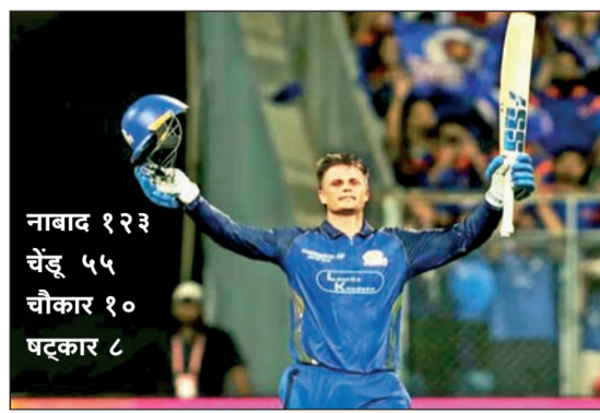
नाबाद १२३ चेंडू ५५ चौकार १० षटकार ८

◆ मुंबई, २९ एप्रिल इंडियन प्रीमियर लीग हंगामात बुधवारी वानखेडे स्टेडियमवर सनरायझर्स हैदराबादविरुद्धच्या आयपीएल सामन्यात सलामीवीर रायन रिकेल्टनच्या बहारदार शतकाचा बळावर मुंबई इंडियन्सने २० षटकांत ५ बाद २४३ धावा उभारल्या. मुंबईने हैदराबादला विजयासाठी २४४ धावांचे आव्हान दिले.