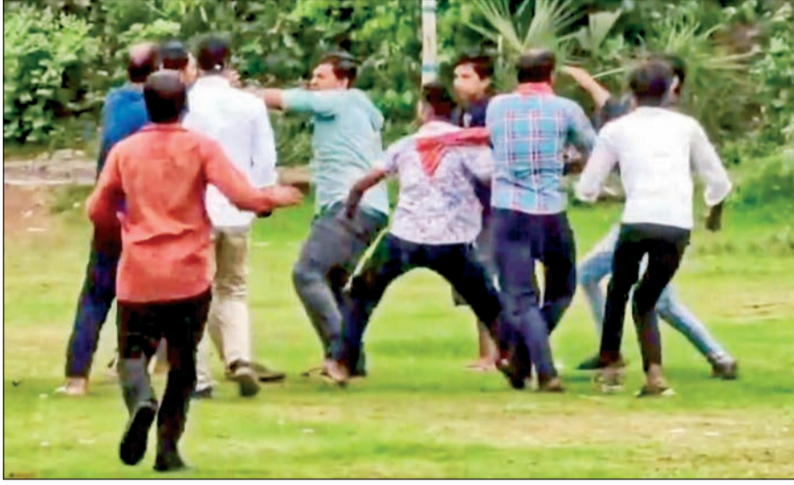
हुबळी जिल्ह्यातील रामचंद्रपूर मतदान संधातील एका केंद्रावर तृणमूल काँग्रेस आणि आयएसएफ समर्थकांमध्ये अशी हाणामारी झाली