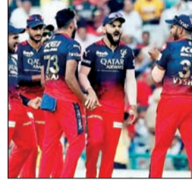
दिल्ली कॅपिटल्सने आतापर्यंत सातपैकी तीन सामन्यात विजय मिळविला व त्यांना चार सामन्यात पराभव पत्करला. ते ६ गुणांसह सहाव्या स्थानावर आहे.

२६४ धावा करूनही झालेल्या मोठ्या पराभवामुळे दुखावलेल्या दिल्ली कॅपिटल्सकडे भावनिकदृष्ट्या सावरण्यासाठी फार कमी वेळ आहे, कारण सोमवारी नवी दिल्लीत होणाऱ्या आयपीएल सामन्यात त्यांचा सामना गतविजेत्या रॉयल चॅलेंजर्स बंगळुरू या आणखी एका बलाढ्य संघाशी होणार आहे. पंजाब किंग्सकडून सहा गडी राखून झालेल्या पराभवामुळे दिल्ली कॅपिटल्स हादरली आहे. या सामन्यात विक्रमी धावसंख्येचा पाठलाग करताना त्यांच्या गोलंदाजांची धुलाई झाली. गुणतालिकेत सहाव्या स्थानावर असलेला हा संघ आता प्ले-ऑफच्या चुरशीच्या शर्यतीत अडकला आहे, जिथे आणखी एक पराभव त्यांच्या संधींना गंभीर धक्का देऊ शकतो.