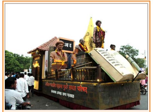
सोलापूर : अखिल भारतीय महात्मा फुले समता परिषदेचा भिडे वाडा चित्ररथ सोलापुरात रविवारी सायंकाळी दाखल झाला.