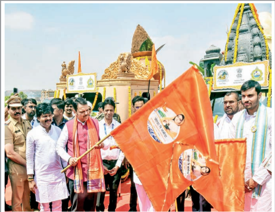
पुण्यश्लोक राजमाता अहिल्यादेवी होळकर यांच्या ३०० व्या जयंतीनिमित्त मुख्यमंत्री देवेंद्र फडणवीस यांच्या हस्ते शनिवारी नाशिक येथे 'गोदा ते नर्मदा पुण्यश्लोक अहिल्यादेवी जलयात्रा २०२६' या यात्रेचा शुभारंभ करण्यात आला.

मुंबई : राज्यात १ मे पासून रिक्षा आणि टॅक्सी चालकांसाठी मराठी भाषा सक्तीची करण्याचा निर्णय जाहीर झाल्यानंतर राजकीय आणि सामाजिक वाद निर्माण झाला आहे. या निर्णयामुळे मुंबईतील काही अमराठी रिक्षा-टॅक्सी चालकांमध्ये नाराजी व्यक्त केली जात आहे. या पुढील भूमीवर शिवसेनेचे नेते संजय निरुपम यांनी या निर्णयाला तीव्र विरोध दर्शवला आहे. अशा प्रकारच्या सक्तीमुळे गरीब आणि रोजगारीवर अवलंबून असलेल्या चालकांच्या उपजीविकेवर परिणाम होऊ शकतो, असे त्यांचे म्हणणे आहे. कोणाचाही रोजीरोटीचा धंदा हिसकावून घेऊ नये. संबंधित मंत्र्यांशी या विषयावर चर्चा झाली असून पुढील आठवड्यात यावर बैठक होणार आहे तसेच आपण चालकांच्या बाजूने भूमिका मांडली असून शासनाने यावर पुनर्विचार करावा, अशी मागणीही त्यांनी केली आहे. या दरम्यान, या मुद्द्यावरून निर्माण झालेल्या वादावर मुख्यमंत्री देवेंद्र फडणवीस यांनीही प्रतिक्रिया दिली आहे. यावरून वाद निर्माण होऊ नये, असे सांगत त्यांनी परिस्थिती शांत ठेवण्याचे आवाहन केले आहे. मात्र, निरुपम यांनी आपली भूमिका अधिक आक्रमकपणे मांडताना आंदोलनावेळी झालेल्या घोषणाबाजी आणि टीकेवरही प्रतिक्रिया दिली.