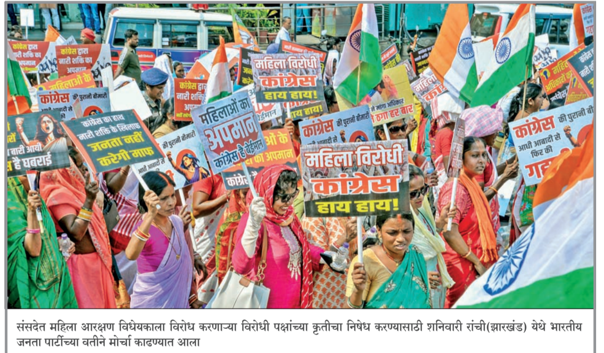
संसदेत महिला आरक्षण विधेयकाला विरोध करणाऱ्या विरोधी पक्षांच्या कृतीचा निषेध करण्यासाठी शनिवारी रांची (झारखंड) येथे भारतीय जनता पार्टीच्या वतीने मोर्चा काढण्यात आला

अमेरिका लोकांशी किंवा सुरक्षेच्या नावाखाली जगाभरातील अनेक देशांमध्ये हस्तक्षेप करत आहे. यामागे नैसर्गिक संसाधने, विशेषतः तेल आणि ऊर्जा बाजारपेठांवर नियंत्रण मिळवणे हा खरा उद्देश आहे. इराण आणि व्हेनेझुएलाची उदाहरणे देत ते म्हणाले की, वॉशिंग्टन आल्या सामरिक गरजा पूर्ण करण्यासाठी सरकार बदलण्यासाठी मार्गोपेढे पाहत नाही. आंतरराष्ट्रीय कायद्याची ताकद कमकुवत होत आहे आणि जग बळावा वापर करूनच न्याय या तत्वाकडे वाटचाल करत आहे. (वृत्तसंस्था)