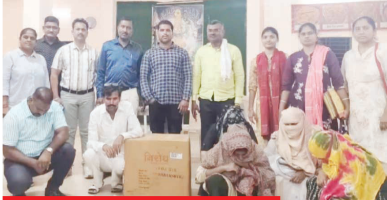
दोन बांगलादेशी महिलांचा समावेश

मिळालेल्या माहितीनुसार, तामलवाडी नजीक असलेल्या 'मिलन लॉज'वर अवैध वेश्या व्यवसाय सुरु असल्याची गोपनीय माहिती पोलिसांना मिळाली होती. या माहितीची खातरजमा करून पोलिसांनी अचानक धाड टाकली असता, लॉजमध्ये तीन महिला आढळून आल्या. त्यांना