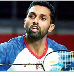
एच. एस. प्रणांय लक्ष्य सेन

नवी दिल्ली, २३ एप्रिल धॉमस चषक व उबर चषक बॅडमिंटन स्पर्धेत भारतीय पुरुष आणि महिला संघ आपल्या मोहिमेची सुरुवात करण्यास सज्ज झाले आहेत. डेन्मार्कच्या हॉर्सेन्स शहरात होणाऱ्या या स्पर्धेच्या पहिल्याच दिवसावर सव्वि लक्ष केंद्रित झाले आहे. २०२२ मध्ये ऐतिहासिक विजेतेपद पटकावणाऱ्या भारतीय पुरुष संघाची मोहीम २४ एप्रिल रोजी भारतीय प्रमाणवेळेनुसार दुपारी १२ वाजता कॅनडाविरुद्ध सुरू होणार आहे. त्यानंतर त्याच दिवशी, यजमान डेन्मार्कच्या संघाशी भारतीय महिला संघ दोन हात करेल. हे सर्व सामने फोरम हॉर्सेन्स येथे खेळले जातील. गट साखळी फेरीत भारताला