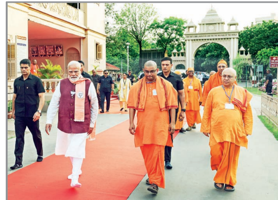
पश्चिम बंगालमध्ये पंतप्रधान नरेंद्र मोदींचा सभाका धडाका सुरू आहे. सभा संपल्यानंतर मोदींनी गुरुवारी हावडा येथील बेलूर मठाला भेट दिली