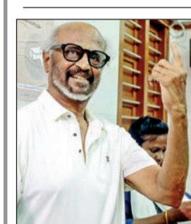
चेन्नई येथील विविध मतदान केंद्रांवर अभिनेते रजनीकांत, कमल हसन, श्रुति हसन, थलपती विजय यांनी मतदानाचा हक्क बजावला