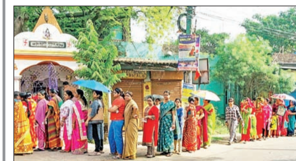
पश्चिम बंगालमधील मिदनापूर येथील केंद्रावर मतदानासाठी लागलेली महिलांची रांग