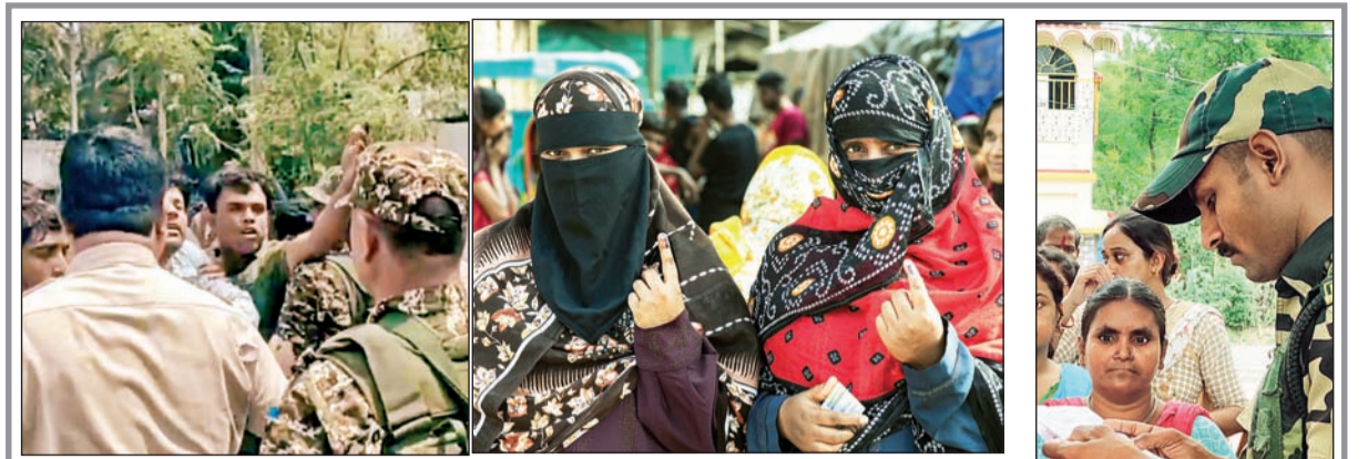
गोंधळी कार्यकर्त्यांना ताब्यात घेताना जवान

कुचबिहारच्या तुफानगंज येथील मतदान केंद्रावर मोठ्या प्रमाणात गर्दी झाल्याने तणाव निर्माण झाला. परिस्थिती नियंत्रणात आणण्यासाठी केंद्रीय सशस्त्र पोलिस दलाला सौम्य लाठीमार करावा लागला. काही असामाजिक तत्व मतदारांच्या घाबरवण्याचा प्रयत्न करीत होते. त्यामुळे बळचा वापर करावा लागल्याने अधिकाऱ्यांनी सांगितले.