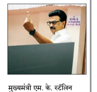
मुख्यमंत्री एम. के. स्टॅलिन