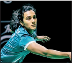
पी. व्ही. सिंधू

सुरुवातीच्या टप्प्यातच एका आव्हानात्मक वेळापत्रकाचा सामना करावा लागणार आहे. पुरुष संघ आपला पुढील सामना २७ एप्रिल रोजी (दुपारी १२ वाजता) ऑस्ट्रेलियाविरुद्ध खेळेल व त्यानंतर २९ एप्रिल रोजी (दुपारी १.३० वाजता) चीनविरुद्ध एका अत्यंत महत्त्वाच्या आणि अटीतटीच्या लढतीसाठी सज्ज होईल. दुसरीकडे, महिला संघ आपली मोहीम