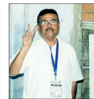
मतदानानंतर विजयी खून दाखविताना भाजपाचे शुभेंद्र अधिकारी