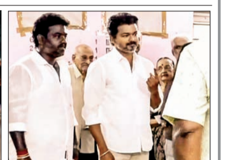
तामिळनाडूतील एका केंद्रावर मतदानासाठी लागलेली रांग