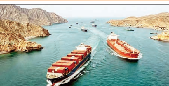
बैठकीचा मुख्य उद्देश होर्मुझमधून होणारी वाहतूक सुरक्षित करण्यासाठी ठोस लष्करी रणनीती तयार करणे हा आहे. यासंदर्भात बोलताना ब्रिटनचे संरक्षण मंत्री जॉन हीली म्हणाले, केवळ राजनैतिक सल्लमतीचे पुरेशी नाही, तर तिचे प्रत्यक्ष संयुक्त नियोजनात रूपांतर होणेही आवश्यक आहे. या बैठकीत लष्करी क्षमता, कमांड आणि कंट्रोल

◆ लंडन, २२ एप्रिल होर्मुझ सामुद्रधुनीचा वापर इराणकडून शस्त्रासारखे केला जात असून, यामुळे जहाजांची वाहतूक विस्कळीत झाली आहे. अमेरिकेची नाकाबंदी आणि इराणनेही हा मार्ग बंद केल्याने अनेक देश मोठ्या ऊर्जा संकटाचा सामना करताना दिसत आहेत. हा मार्ग आता पुन्हा सुरू करण्यासाठी ब्रिटन- फ्रान्सच्या नेतृत्वात ३० देश एकवटले आहे. लंडनमध्ये या देशांच्या लष्करी नियोजकांची महत्वाची बैठक होणार असून, यात होर्मुझमध्ये सैन्य तैनात करण्यावर चर्चा होणार आहे.