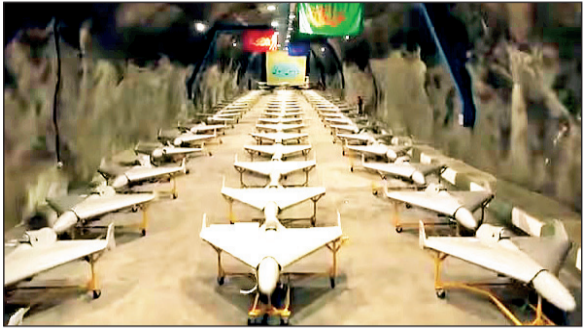
२८ फेब्रुवारीपासून सुरू झालेले युद्ध पावणे दोन महिने होऊनही सुरूच आहे. इराणने भुयारात सुरक्षित ठेवलेले आत्मघाती ड्रॉन्स

◆ वॉशिंग्टन, २२ एप्रिल इराणची लष्करी क्षमता मोठ्या प्रमाणात मजबूत आहे, असून जमिनीखाली क्षेपणास्त्र आणि ड्रोनचा मोठा साठा आणि लॉचर अगदी सुरक्षित असल्याचा दावा संरक्षण विभागाच्या (पेंटागॉन) अहवालातून करण्यात आला. या अहवालाने राष्ट्राध्यक्ष डॉनाल्ड ट्रम्प आणि संरक्षण मंत्री पीट हेगसेथ यांनी केलेले सर्व दावे फोत असल्याचे समोर आले आहे.