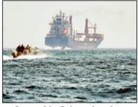
दूरचित्रवाणीने दिले आहे. ग्रीकच्या मालकीची युफोरिया या तिसऱ्या नौकेलाही लक्ष्य करण्यात आले. ही नौका सध्या इराणच्या किनाऱ्यालागत अडकून पडली आहे.

महत्त्वाचा मार्ग असलेल्या होर्मुझमधील जाण्याचा प्रयत्न करणाऱ्या भारताचा ध्वज लावलेल्या दोन जहाजांवर हल्ला झाल्यामुळे इराण आणि भारतातील तणाव वाढण्याची शक्यता निर्माण झाली आहे. पनामाचा ध्वज असलेले एमएससी फ्रान्सेका आणि लायबेरियाचा ध्वज असलेले ईपामिनोडास ही दोन जहाजे आता आयआरसीसीच्या ताब्यात असून, त्यांना इराणमध्ये नेण्यात आल्याचे वृत्त इराणमधील सरकारी