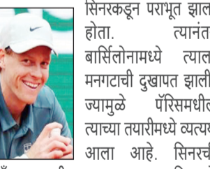
सिनरकडून पराभूत झाला होता. त्यानंतर बार्सिलोनामध्ये त्याला मनगटाची दुखापत झाली, ज्यामुळे पॅरिसमधील त्याच्या तयारीमध्ये व्यत्यय आला आहे. सिनरची प्रगती या आठवड्यात माद्रिदमध्ये सुरू राहिल. तो इतर युरोपियन क्ले कोर्टच्या तुलनेत अधिक उंचीवर आहे आणि त्यामुळे कोर्टचा वेग

आगामी २४ मेपासून येथे प्रारंभ होणाऱ्या फ्रेंच ओपन टेनिस स्पर्धेसाठी इटलीचा जॅनिक सिनर सज्ज होत आहे. चार वेळा ग्रॅंड स्लॅम विजेता असलेल्या सिनरने आपल्या संयम आणि नियंत्रणावर केल्या अथक परिश्रामामुळे फ्रेंच ओपनमध्ये तो क्ले कोर्टवर प्रतिस्पर्धांवर मात करण्यासाठी एक प्रमुख खेळाडू झाला आहे. सिनरचे