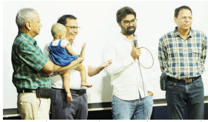
राठी चित्रपट ठरलेला आणि फ्रान्समध्ये रसिकांच्या कौतुकाचा विषय ठरलेला मदार चित्रपट महोत्सवात जगभरातील मदार चित्रपट सोलापूरकरांना पाहता

२१ व्या पुणे आंतरराष्ट्रीय चित्रपट महोत्सवात सर्वोत्कृष्ट आंतरराष्ट्रीय म