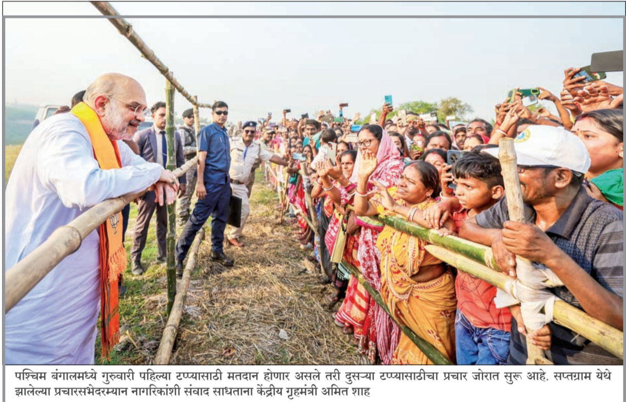
पश्चिम बंगालमध्ये गुरुवारी पहिल्या टप्प्यासाठी मतदान होणार असले तरी दुसऱ्या टप्प्यासाठीचा प्रचार जोरात सुरू आहे. सप्तग्राम येथे झालेल्या प्रचारसभेदरम्यान नागरिकांशी संवाद साधताना केंद्रीय गुह्यमंत्री अमित शहा

मात्र, अनेकांना मराठी भाषेची साधी जाणही नसल्याने प्रवाशांना नाहक मनस्ताप सहन करावा लागत असल्याच्या तक्रारी वारंवार पुढे येत आहेत. याच पार्श्वभूमीवर परिवहन विभागाने हा विषय गांभीर्याने घेतला आहे. या निर्णयाची कल्पना आणि प्रशिक्षणाचा आराखडा ठरवण्यासाठी उद्या, २४ एप्रिल रोजी दुपारी ११ वाजता परिवहन मंत्री प्रताप सरनाईक यांच्या अध्यक्षतेखाली मंत्रालयात महत्त्वाची बैठक होणार आहे. यात परिवहन आयुक्तांसह राज्यातील दिग्गज साहित्यिक, भाषा तज्ज्ञ आणि प्रशासकीय अधिकारी सहभागी होणार आहेत. वाहनचालकांना मराठीचे प्राथमिक शिक्षण देण्यासाठी विशेष अभ्यासक्रम तयार करण्यावर या बैठकीत मुख्यत्वे चर्चा होणार आहे.