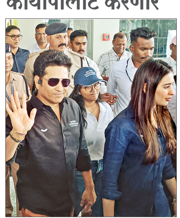
क्रिकेट दिग्गज सचिन तेंडुलकरचे बुधवारी छत्तीसगढमधील बस्तर, जगदलपूर येथील माँ देवेश्वरी विमानतळावर आगमन झाले, तेव्हाचा क्षण

क्रिकेट दिग्गज सचिन तेंडुलकर छत्तीसगढमधील दंतेवाडा येथे एका तळागाळातील क्रीडा उपक्रमाचे नेतृत्व करीत आहे. एकेकाळी नक्षत्रप्रस्त असलेल्या या प्रदेशातील तरुणांसाठी एका भरभराटीस आलेल्या क्रीडा केंद्रात रूपांतर करणे हा या उपक्रमाचा उद्देश आहे. सचिन तेंडुलकर जगदलपूर विमानतळावर दाखल झाला व त्यानंतर त्याने दंतेवाडा जिल्ह्यातील छिंदनार गावाला भेट दिली. या ठिकाणी मैदान कप उपक्रमांतर्गत एका कार्यक्रमाचे आयोजन करण्यात आले आहे. मैदान कप उपक्रमांतर्गत आम्ही सुमारे ५० शाळांची क्रीडांगणे विकसित केली आहेत, याचा मला मनस्वी आनंद होत आहे, असे तेंडुलकर जगदलपूर विमानतळावर पत्रकारांशी संवाद साधताना म्हणाला. दंतेवाडा येथे मैदान कप स्पर्धेचे आयोजन करण्यात आले असून, याला मानदेशी व सचिन तेंडुलकर फाऊंडेशनचा पाठिंबा लाभला आहे. या उपक्रमांमुळे ५,००० हून अधिक मुलांना फायदा होत आहे.