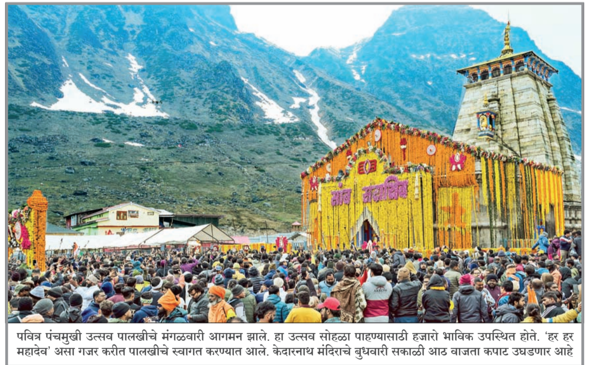
पवित्र पंचमुखी उत्सव पालखीचे मंगळवारी आगमन झाले. हा उत्सव सोहळा पाहण्यासाठी हजारो भाविक उपस्थित होते. 'हर हर महादेव' असा गजर करीत पालखीचे स्वागत करण्यात आले. केदारनाथ मंदिराचे बुधवारी सकाळी आठ वाजता कपाट उघडणार आहे

पाहिले आहे. उपमुख्यमंत्री झाल्यापासून वहिनींचे कामाची क्षमता मी पाहिली असून दादांची सर्व स्वयं पूर्ण करण्याची क्षमता सुनेत्रावहिनी यांच्यात आहे, असे मुख्यमंत्री यावेळी म्हणाले. (तथा वृत्तसेवा)