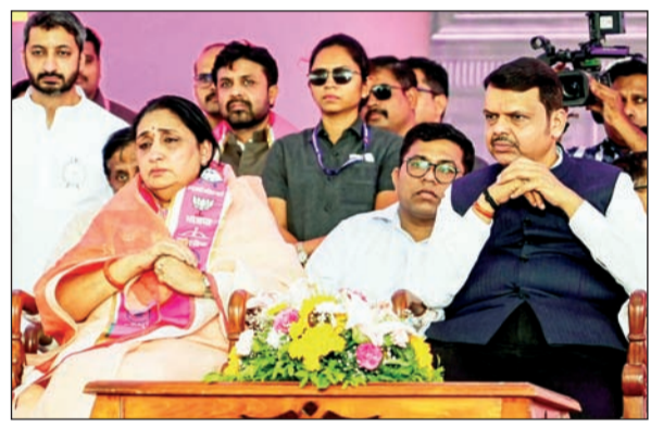
प्रचाराच्या शेवटच्या दिवशी झालेल्या सभेला उपस्थित मुख्यमंत्री देवेंद्र फडणवीस आणि उमेदवार सुनेत्रा पवार व पदाधिकारी