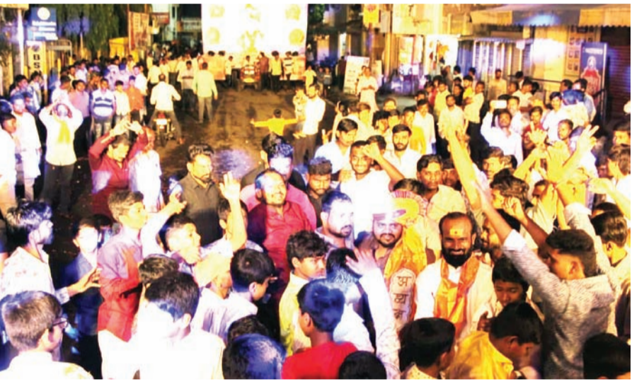
सोलापूर : मंगळवारी सायंकाळी महात्मा बसवेश्वर जन्मोत्सवनिमित्त मंडळांनी उत्साही वातावरणात भव्य मिरवणूक काढली. त्याप्रसंगी जल्लोष करताना टिपलेले छायाचित्र.