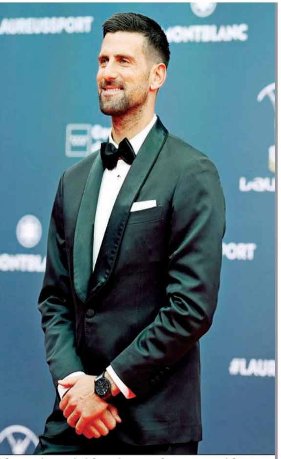
टेनिसपटू नोवाक जोकोविच स्पेनच्या माद्रिद शहरात आयोजित एका जागतिक क्रीडा पुरस्कार समारंभात सहभागी होण्यासाठी आला असता त्याने अशी पोझ दिली