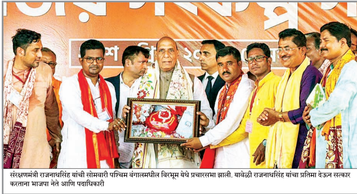
संरक्षणमंत्री राजनाथसिंह यांची सोमवारी पश्चिम बंगालमधील बिरभूम येथे प्रचारसभा झाली. यावेळी राजनाथसिंह यांचा प्रतिमा देऊन सत्कार करताना भाजपा नेते आणि पदाधिकारी