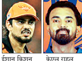
ईशान किशन केएल राहुल

सनरायझर्स हेदराबादने आपल्या गत सामन्यात दमदार कामगिरी करीत, चेन्नई सुपर किंग्सवर १० धावांनी दणदणीत विजय मिळवला. हेदराबाद संघाच्या वरच्या फळीतील