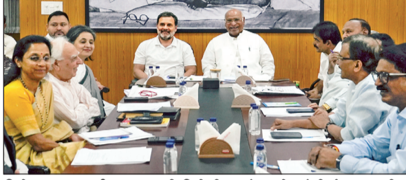
विधेयकावर चर्चा करण्यासाठी विरोधी पक्षांच्या नेत्यांची बैठक झाली

◆ लोकसभा तसेच राज्य विधानसभातील लोकप्रतिनिधींच्या संख्येत सरसकट ५० टक्क्यांनी वाढ करण्याचा सरकारचा प्रस्ताव आहे. लोकसभेतील खासदारांची संख्या ८५० करण्याचा सरकारचा प्रस्ताव आहे. यातील ८१५ जागा विविध राज्यातील राहणार असून ३५ जागा केंद्रशासित प्रदेशासाठी ठेवण्यात आल्या आहेत. २०२९ च्या जनगणनेच्या आधारावर मतदारसंघांची फेररचना केली जाणार आहे.