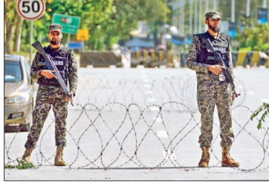
इस्लामाबादमध्ये लावण्यात आलेला कडेकोट बंदोबस्त

इसायलकडून लेबनॉनवर सुरू असलेल्या हल्ल्यामुळे अटीचे उल्लंघन होत असल्याचा आरोप