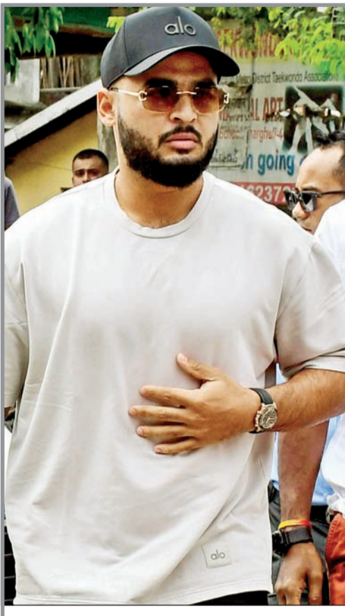
आसाम विधानसभा निवडणुकीदरम्यान, क्रिकेटपटू रियान परगाम मतदान करण्यासाठी गुवाहाटी येथील एका मतदान केंद्रावर दाखल झाला