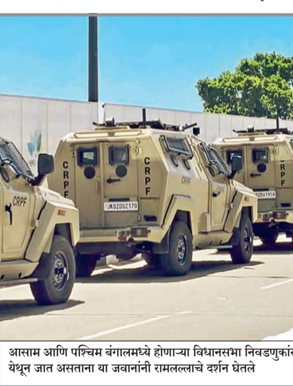
आसाम आणि पश्चिम बंगालमध्ये होणाऱ्या विधानसभा निवडणुकांसाठी निमलष्करी दलाच्या तुकड्या रवाना करण्यात आल्या आहेत. अयोध्या येथून जात असताना या जवानांनी रामलल्लाचे दर्शन घेतले

१९ व्यक्ती मृत्युमुखी पडल्या. गुजरातमधील जवळपास ३० शोकाकुल कुटुंबांनी शनिवारी अहमदाबाद येथे भेट घेतली आणि पंतप्रधानांना पत्र लिहून, या दुर्घटनेमागील सत्य उलगडण्यासाठी सीव्हीआर आणि ब्लॅक बॉक्समधील डेटा सार्वजनिक करण्याची विनंती केली. अपघाताचे कारण काय होते आणि त्यात काही तांत्रिक बिघाड होता का, याबद्दलचे सत्य आम्हाला जाणून घ्यायचे आहे, असे त्यांनी पत्रात म्हटले आहे.