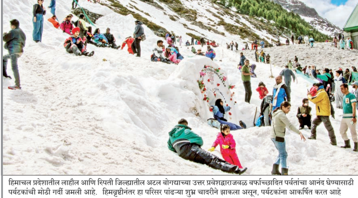
हिमाचल प्रदेशातील लाहौल आणि स्पिति जिल्ह्यातील अटल बोगद्याच्या उत्तर प्रवेशद्वाराजवळ बर्फाच्छादित पर्वतांचा आनंद घेण्यासाठी पर्यटकांची मोठी गर्दी जमली आहे. हिमवृष्टीनंतर हा परिसर पांढऱ्या शुभ्र चादरीने झाकला असून, पर्यटकांना आकर्षित करत आहे

एक जिहादी माँड्युल उघडकीस आले आहे. हे माँड्युल भारतातील तरुणांना अतिरेकी करण्यात गुंतलेले होते, असे गुप्तचर विभागाच्या एका अधिकाऱ्याने सांगितले. हे माँड्युल अतिरेकी सामुग्रीचा प्रसार करायचे आणि विदेशी सूत्रधारांच्या संपर्कात होते, असे अधिकाऱ्याने सांगितले.