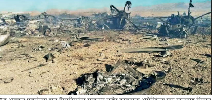
इराणमध्ये अडकून पडलेल्या दोन वैमानिकांना सुखरूप बाहेर काढताना अमेरिकेला एक मालवाहू विमान आणि दोन हेलिकॉप्टर गमवावी लागली. विमान, हेलिकॉप्टर पाडल्याचा दावा इराणने केला तर शत्रूच्या हाती पडू नये म्हणून स्वतःहा उडविल्याचा दावा अमेरिकेने केला आहे

अमेरिकेच्या सैन्याने धाडसी मोहीम राबवत इराणच्या डोंगराळ भागात अडकलेल्या दोन वैमानिकांची सुखरूप सुटका केली. इराणच्या गुप्तचर संस्थेला पत्ता न लागू देता आणि हवाई संरक्षण यंत्रणेला जाम करीत ही कारवाई करण्यात आली. ३६ तासांच्या मोहिमेनंतर दोन्ही वैमानिकांना सुखरूप आणले. अमेरिकन लष्कराच्या इतिहासातील ही एक धाडसी मोहिम होती, अशी माहिती अध्यक्ष डोनाल्ड ट्रम्प यांनी दिली आहे. या मोहिमेदरम्यान अमेरिकन हवाई दलाचे एक मालवाहू विमान आणि दोन हेलिकॉप्टर नष्ट झाले.