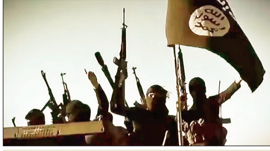
ओसामा बिन लादेनचे व्हिडीओ