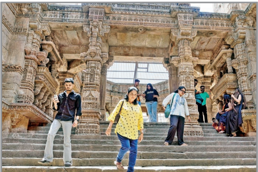
गुजरातमध्ये गांधीनगरजवळ असलेल्या अडालज येथील पुरातन रुवावाईच्या विहीर पर्यटकांच्या आकर्षणाचे केंद्र आहे. रखरखल्या उन्हात येथे विहीर पाहण्यासाठी आलेले पर्यटक

कर्जाची मुदत वाढवून देत असे. यावेळी डिसेंबर २०२५ मध्ये केवळ दोन महिन्यांची मुदतवाढ देण्यात आली. याची अंतिम मुदत १७ एप्रिल रोजी संपत आहे. मात्र, मुदतीपूर्वी कर्जाची रक्कम परत करावी असा निर्देश यूएईने पाकिस्तानला दिले. कर्जाची रक्कम परत केल्यामुळे पाकिस्तानच्या गंगाजळीत मोठी घट होईल. चालू आर्थिक वर्षात पाकिस्तानला सौदी अरबला पाच अब्ज डॉलर्स, चीनचे चार अब्ज डॉलर्सचे कर्ज परत करावेचे आहे. (वृत्तसंस्था)