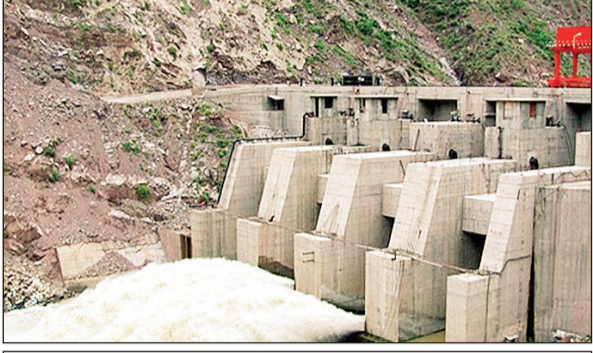
प्रकल्पाची क्षमता वाढवली जाणार

विशेष म्हणजे, १९५० पर्यंत हा काश्मीर खोऱ्याचा प्रमुख वीज स्रोत होता. १९९२ मध्ये आलेल्या भूकंपामुळे या प्रकल्पाचे मोठे नुकसान झाले. त्यानंतर हा प्रकल्प