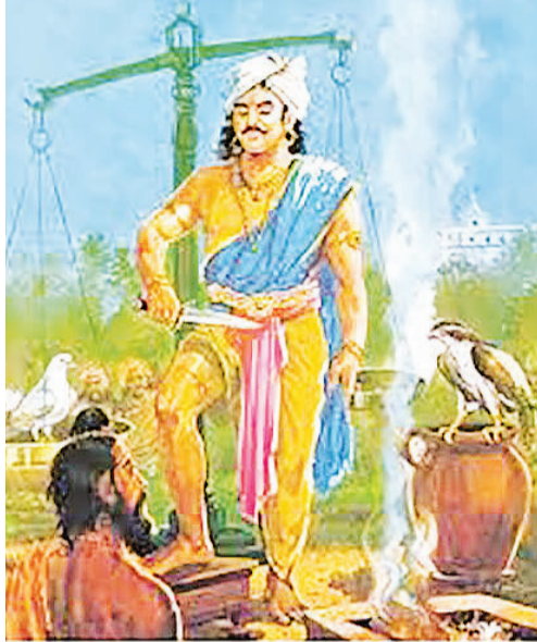
कपोताच्या भाराइतके स्वतःचे मांस कापून देणारा राजा शिबी

तुझ्या मुखावर प्रसन्न भाव हवेत तरच मला शाश्वती वाटेल की, तू हे सारं स्वच्छेनं करतो आहेस.' ससाणा म्हणाला. शिबी राजानं त्याच्या सर्व अटी मान्य केल्या आणि त्यानं एका सुवर्णतुले (सोन्याच्या तराजू) त एका पारड्यात कपोताला ठेवलं.