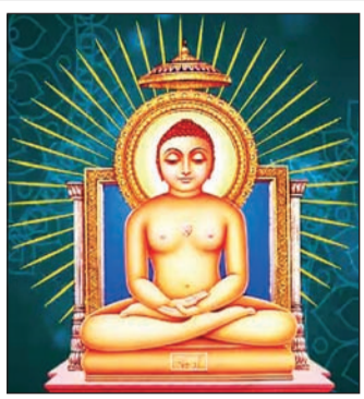
आज भगवान महावीर यांची जयंती