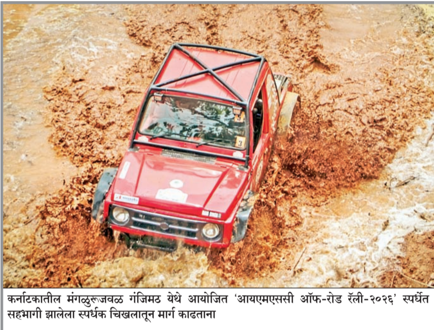
कनटकातील मंगळुरुजवळ गंजिमठ येथे आयोजित 'आयएमएससी ऑफ-रोड रॅली-२०२६' स्पर्धेत सहभागी झालेला स्पर्धक चिखलातून मार्ग काढताना

रस्त्यांवर चालण्यासाठी पूर्णपणे योग्य आहेत याचा पुरावा हे 'ग्रीन कार्ड' आहे. याशिवाय कोणत्याही वाहनाला ऋषिकेशहून पुढे यात्रा मार्गावर जाण्याची परवानगी दिली जाणार नाही. परिवहन विभागाने वाहन मालकांच्या सोयीसाठी तीन प्रमुख ठिकाणी नोंदणी आणि तपासणी केंद्रे तयार केली आहेत. ऋषिकेश प्रवासाचा मुख्य थांबा असल्यामुळे येथे सर्वात मोठे केंद्र बनवले आहे. हरिद्वार येथील रोशनाबाद येथे एआरटीओ कार्यालयात स्थानिक आणि बाहेरील वाहनांसाठी व्यवस्था केली आहे. नारसन बॉर्डर येथे यूपी आणि इतर राज्यांतून येणाऱ्या वाहनांसाठी विशेष डेस्क स्थापित केला आहे. ग्रीन कार्ड जारी करण्यापूर्वी विभाग कागदपत्रांची सखोल तपासणी करणार आहे. गर्दी टाळण्यासाठी परिवहन विभागाने ऑनलाईन अर्ज करण्याची सुविधाही दिली आहे. वाहन मालक अधिकृत संकेतस्थळावर जाऊन आवश्यक कागदपत्रे अपलोड करू शकतात. यानंतर केंद्रांवर जाऊन प्रत्यक्ष पडताळणी करून कार्ड मिळवू शकतात. ■