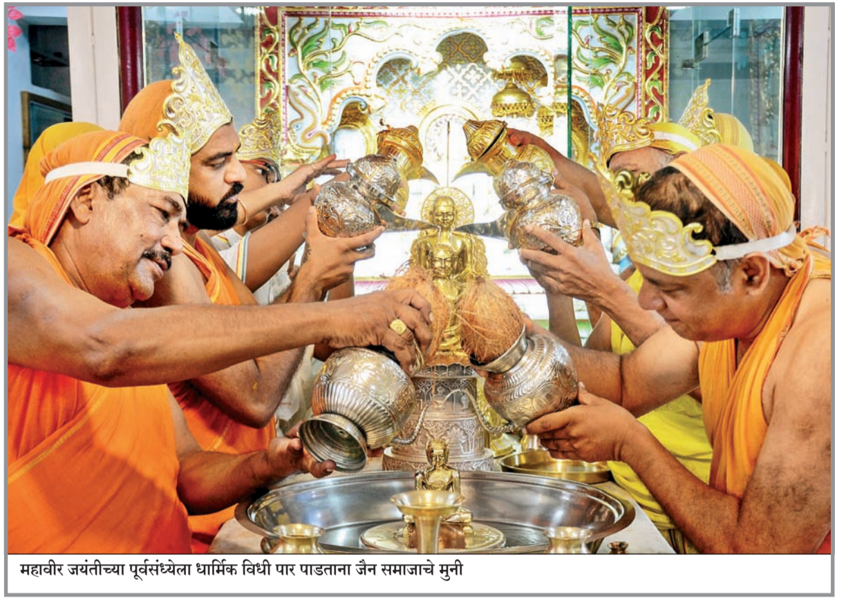
महावीर जयंतीच्या पूर्वसंध्येला धार्मिक विधी पार पाडताना जैन समाजाचे मुनी

नेपाळचे पंतप्रधान बालेंद्र शाह यांनी चार माजी पंतप्रधान, तत्कालीन अधिकाऱ्यांच्या मालमत्तांच्या चौकशीचा आदेश दिला. यात केपी शर्मा ओली, पुष्प कमल दहल प्रचंड, शेर बहादूर देउबा आणि माधवकुमार नेपाळ यांचा समावेश आहे. नवीन सरकारने १००-कलमी कृती योजनेचा भाग म्हणून माजी राष्ट्रप्रमुख, वरिष्ठ राजकारणी आणि नोकरशहा यांच्या मालमत्तेची चौकशी करण्यासाठी भ्रष्टाचार प्रतिबंधक आयोगाची स्थापना केली. या आयोगात कायदा, वित्त, महसूल आणि संशोधन क्षेत्रातील तज्ज्ञांचा समावेश आहे. पहिल्या टप्प्यात २००६ च्या नेपाळी क्रांतीनंतर प्रमुख पदांवर असलेल्या व्यक्ती, तर दुसऱ्या टप्प्यात १९९१ ते २००६ दरम्यान प्रमुख पदांवर असलेले नेते आणि त्यांच्या कार्यकाळातील प्रमुख अधिकाऱ्यांच्या मालमत्तांची चौकशी केली जाणार आहे. ■