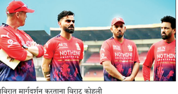
शिबिरात मार्गदर्शन करताना विराट कोहली

बंगळूर, २१ मार्च आपल्या विजेतेपदाचे रक्षण करण्यासाठी सज्ज होत असताना, संघाचा आधारस्तंभ असलेला धडाकेबाज फलंदाज विराट कोहलीने शनिवारी आपल्या सॅमल चॅलेंजर्स बंगळूर (आरसीबी) संघातील सहकाऱ्यांना पूर्णपणे सज्ज होण्याचे आणि सराव सत्रांमधील एकही मिनिट वाया न घालवण्याचे आवाहन केले. एम. चिन्नास्वामी स्टेडियमवर झालेल्या सराव सत्रादरम्यान संघाला संबोधित करताना, कोहलीने गत वर्षी संघाला विजेतेपद मिळवून देणारी तीच तीव्रता कायम राखण्याची गरज असल्याचे सांगितले. आपल्या आयपीएल २०२६ मोहिमेची सुरुवात २८ मार्च रोजी एम. चिन्नास्वामी स्टेडियमवर सनरायडर्स हैदराबाद विरुद्धच्या सामन्याने होणार आहे.