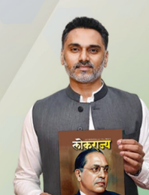
योगेश कदम महसूल राज्यमंत्री