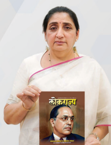
सुनेत्रा अजित पवार उपमुख्यमंत्री