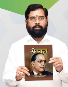
एकनाथ शिंदे उपमुख्यमंत्री