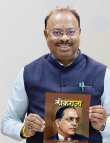
चंद्रशेखर बावनकुळे महसूल मंत्री