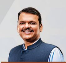
देवेंद्र फडणवीस मुख्यमंत्री