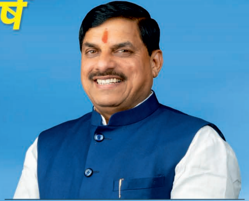
डॉ. मोहन यादव, मुख्यमंत्री