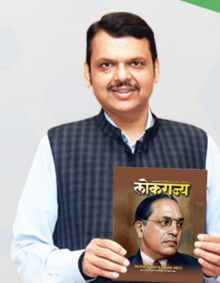
देवेंद्र फडणवीस मुख्यमंत्री

२०२६- २०२७ या आर्थिक वर्षात योजनेसाठी एक हजार कोटींची तरतूद