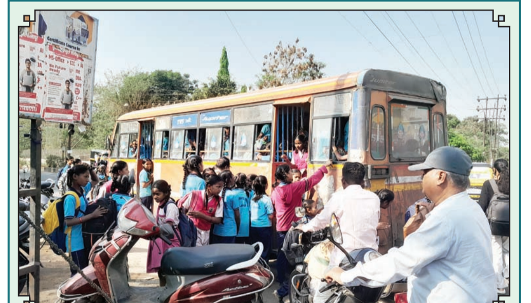
सोलापूर : उन्हामुळे सर्व सर्व शाळा लवकर भरत व लवकर सुटत आहे. यावेळी बस पकडताना विद्यार्थी.