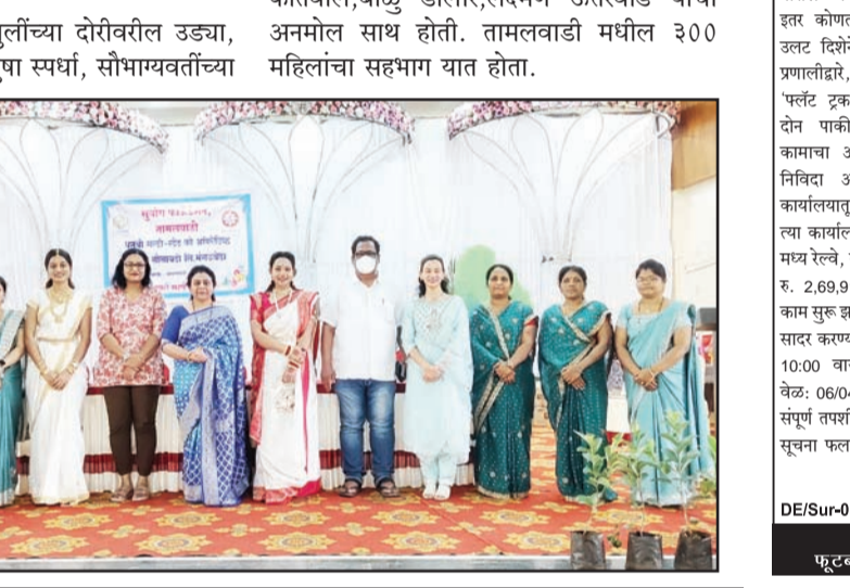
सोलापूर येथील महिला कार्यकर्त्यांच्या संमेलनाचा कार्यक्रम. डावीकडून सुरुवात होऊन उजवीकडे सुरुवात होऊन महिला कार्यकर्त्यांच्या संमेलनाचा कार्यक्रम संपन्नपणे संपला.