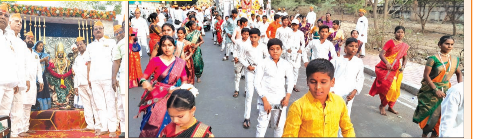
भावसार समाज कुलस्वामिनी हिंगुलाबिकादेवी प्रकट दिनानिमित्त मंगळवारी सायंकाळी सोलापूर शहरातील प्रमुख मार्गावरून शोभायात्रा काढण्यात आली.