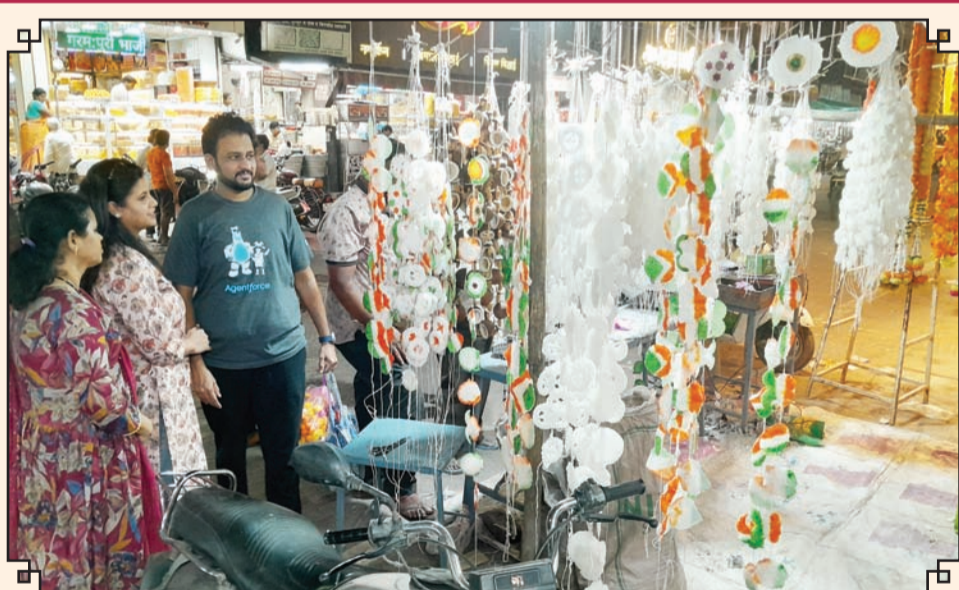
सोलापूर शहरातील मधला मारुती परिसरातील मिठाई गल्लीत गुढीपाडव्यानिमित्त साखरहारांची खरेदी करण्यासाठी नागरिकांची लगबग दिसून आली.

सोलापूर जिल्ह्यात आरटीई अंतर्गत एकूण २८६ शाळांमध्ये २,८७२ जागा उपलब्ध आहेत. यामध्ये शहरातील १७ शाळांमध्ये २५७ जागा, तर जिल्ह्यातील ११ तालुक्यांतील २६९ शाळांमध्ये २,६१५ जागा आहेत. आतापर्यंत सुमारे ४,५७० अर्ज प्राप्त झाले आहेत. मुदतवाढीनंतर आणखी अर्ज वाढण्याची शक्यता वर्तविली जात आहे.