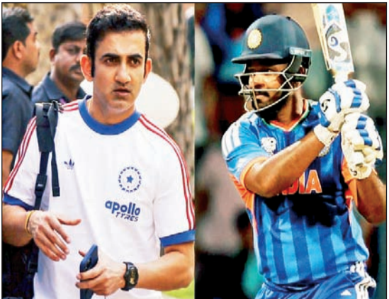
गौतम गंभीर व संजू सॅमसन

नवी दिल्ली, १५ मार्च संजू सॅमसनमध्ये अशी जबरदस्त क्षमता आहे की, जेव्हा तो आपल्या सर्वोत्तम व आक्रमक लयीत असतो, तेव्हा तो पॉवरप्लेमध्येच प्रतिस्पर्धांच्या हातून सामना हिरावून घेऊ शकतो, असे भारतीय संघाचे मुख्य प्रशिक्षक गौतम गंभीर यांनी म्हटले आहे.