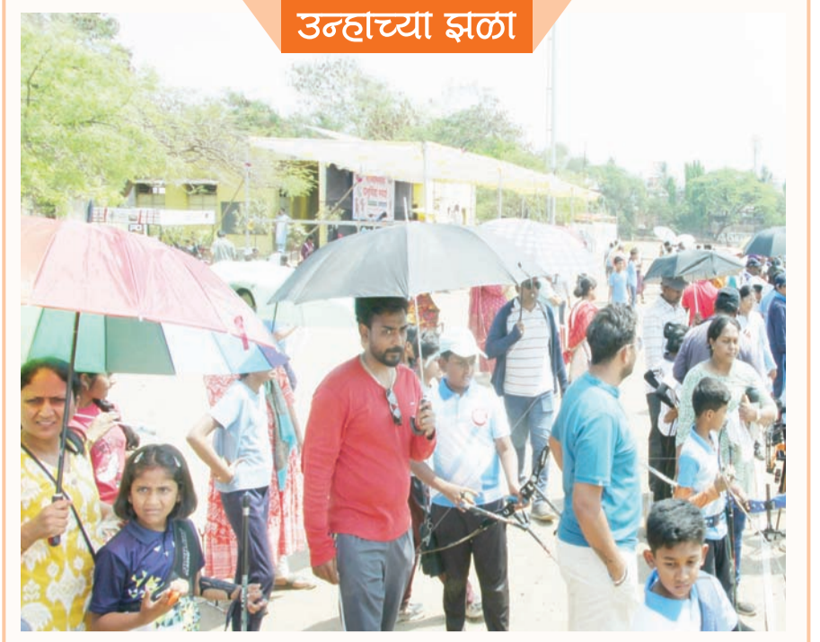
सोलापूर : नेहरूनगर परिसरातील शासकीय मैदानावर सुरू असलेल्या राज्यस्तरीय धनुर्विद्या स्पर्धेत राज्यातून विविध जिल्ह्यातून खेळाडू व त्यांचे पालक आले आहेत. उन्हाच्या झळापासून ते छत्रीचा आसरा घेत ते या स्पर्धेचा आनंद घेत आहेत.