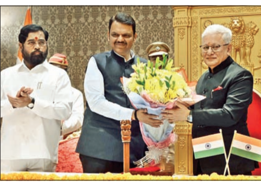
राज्यपालांचे अभिन्नद्वन करताना मुख्यमंत्री देवेंद्र फडणवीस आणि उपमुख्यमंत्री एकनाथ शिंदे