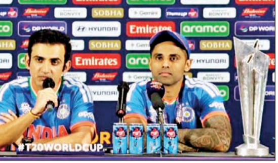
पत्रपरिषदेत बोलताना प्रशिक्षक गौतम गंभीर व कर्णधार सूर्यकुमार यादव

अहमदाबाद, ८ मार्च या ऐतिहासिक टी-२० विश्वचषक विजयाचे श्रेय भारतीय संघाचे माजी प्रशिक्षक राहुल द्रविड व माजी दिग्गज फलंदाज व्ही. व्ही. एस. लक्ष्मण यांना जाते. मी ही टॉफी त्यांना समर्पित करतो, असे भारतीय संघाचे मुख्य प्रशिक्षक गौतम गंभीर म्हणाले.