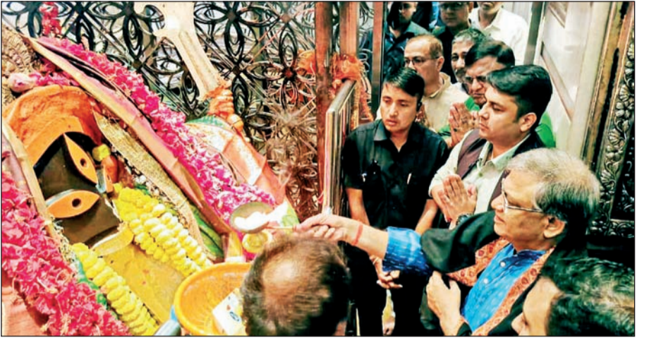
कालीघाट मंदिर येथे आरती करताना मुख्य निवडणूक आयुक्त ज्ञानेश कुमार

'चले जाव'च्या घोषणा; काळे झेंडेही दाखवले