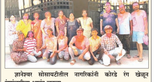
ज्ञानेश्वर सोसायटीतील नागरिकांनी कोरडे रंग खेळून रंगपंचमीचा आनंद लुटला.