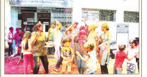
बाल सुधारगृहात मुर्लींनी उत्साहात रंगपंचमी साजरी केली