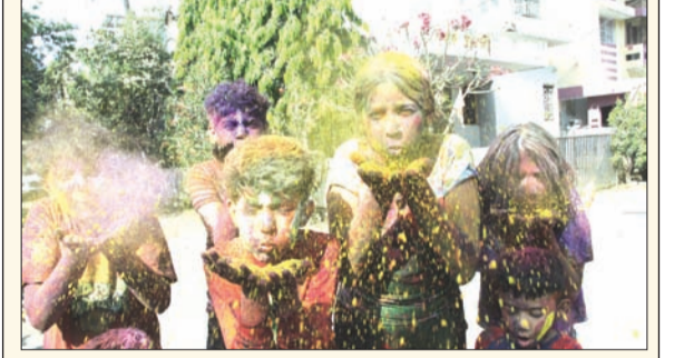
महेश नगर परिसरात बालगोपालाची रंगपंचमी.