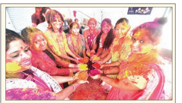
गोविंद सहकारी सोसायटी येथील महिलांची रंगपंचमी

नमो शेतकरी महासन्मान निधी : ज्या महिलांच्या नावावर शेती आहे, त्यांना केंद्र व राज्य सरकारकडून दरवर्षी १२,००० रुपये सन्मान निधी दिला जातो. यासोबतच लाडकी बहीण योजनेचा लाभही मिळतो.