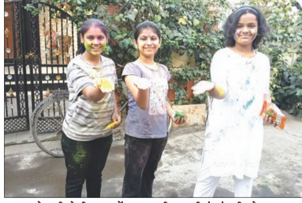
मजरेवाडी येथील राधवेद्वनगर मधील मुली रंगपंचमी खेळताना.