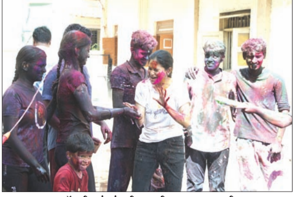
आयकर कॉलनीत रंगपंचमी साजरी करण्यात आली.