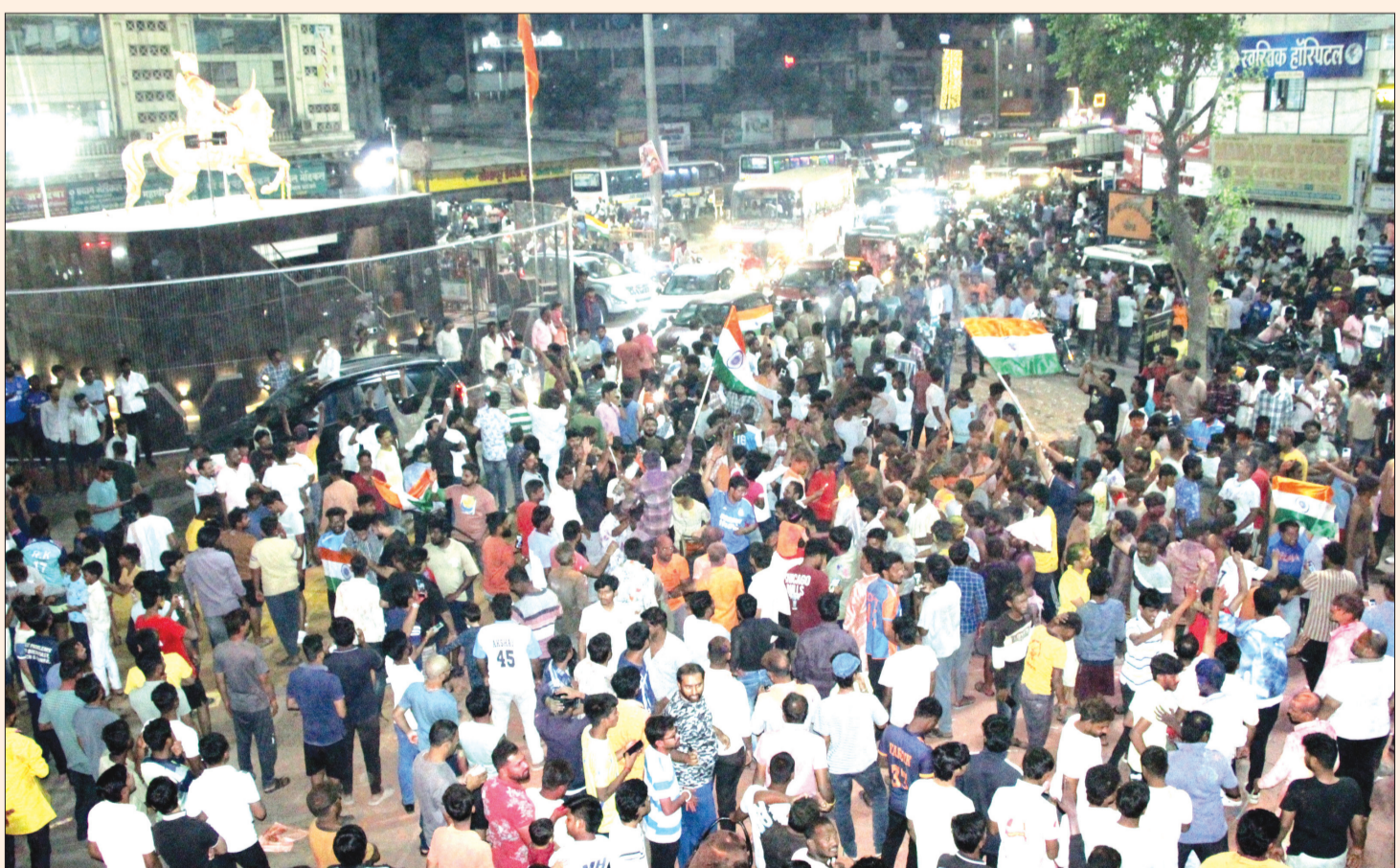
सोलापूर : टीम इंडियाने विजय मिळविल्यानंतर छत्रपती शिवाजी चौकात जल्लोष करतानाचा रविवारी रात्री टिपलेला क्षण.