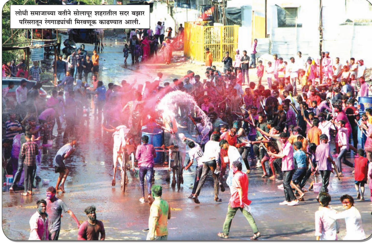
लोधी समाजाच्या वतीने सोलापूर शहरातील सदर बझार परिसरातून रंगगाड्यांची मिरवणूक काढण्यात आली.