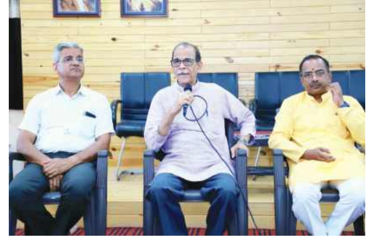
कुटुंब प्रबोधन, स्व आधारित जिवन, च्या जिवनात अचरण करावे यासाठी नागरिक कर्तव्य याचे समाजाने स्वतः जनप्रबोधन केले जात आहे.

संघकाम होत आहे. संघाच्या संघटन आणि सेवेची १०० वर्षे हे व्यापक गृहसंपर्क अभियानाच्या माध्यमातून भारतभर घरोघरी माहिती दिली जात आहे. समाजातील प्रमुख नागरिकांच्या एक्त्रीकरणाने संगोष्ठी सारखे कार्यक्रमाचे आयोजन केल जात आहे त्याला उत्तम प्रतिसाद मिळत आहे. समाजातील विविध वर्ग आणि संघटन यांच्या सोबत सद्भावना बैठकांचे आयोजन केले जात आहे. व्यापक प्रमाणावर समाज संघटील व्हावा म्हणून गाव, प्रभाग पातळीवर हिंदु संमेलनाचे आयोजन होत असून समाज प्रबोधन केले जात आहे. संघाचे मुख्य काम व्यक्ती निर्माणचे आहे असे सांगून या शताब्दी वर्षात पंचपरिवर्तनाचे सुत्र मांडले आहे. या पंचपरिवर्तना मध्ये सामाजिक समरसता, पर्यावरण संरक्षण,