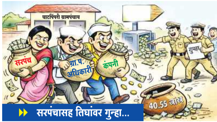
स्वतःच्या फायद्यासाठी वळवण्यात आल्याचे प्राथमिक तपासात निष्पन्न झाले आहे.