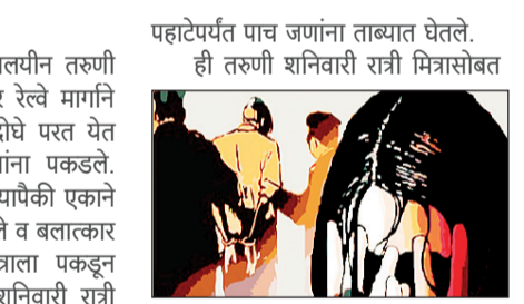
पहाटेपर्यंत पाच जणांना ताब्यात घेतले. ही तरुणी शनिवारी रात्री मित्रासोबत

◆ अमरावती, २९ मार्च अठरा वर्षीय महाविद्यालयीन तरुणी मित्रासोबत दुचाकीवर चांदूर रेल्वे मार्गाने फिरायला गेली होती. ते दोघे परत येत असताना पाच जणांनी त्यांना पकडले. दोघांनाही मारहाण केली. त्यापैकी एकाने तरुणीला जंगलात ओढून नेले व बलात्कार केला. इतरांनी तिच्या मित्राला पकडून ठेवले. ही थारक घटना शनिवारी रात्री साडेअकराच्या सुमारास उघड झाली. या दुचाकीने फेरफटका मारण्यासाठी चांदूर पोलिसांनी विनंती वारंवार करण्यात येत आहे. (तथा वृत्तसेवा)