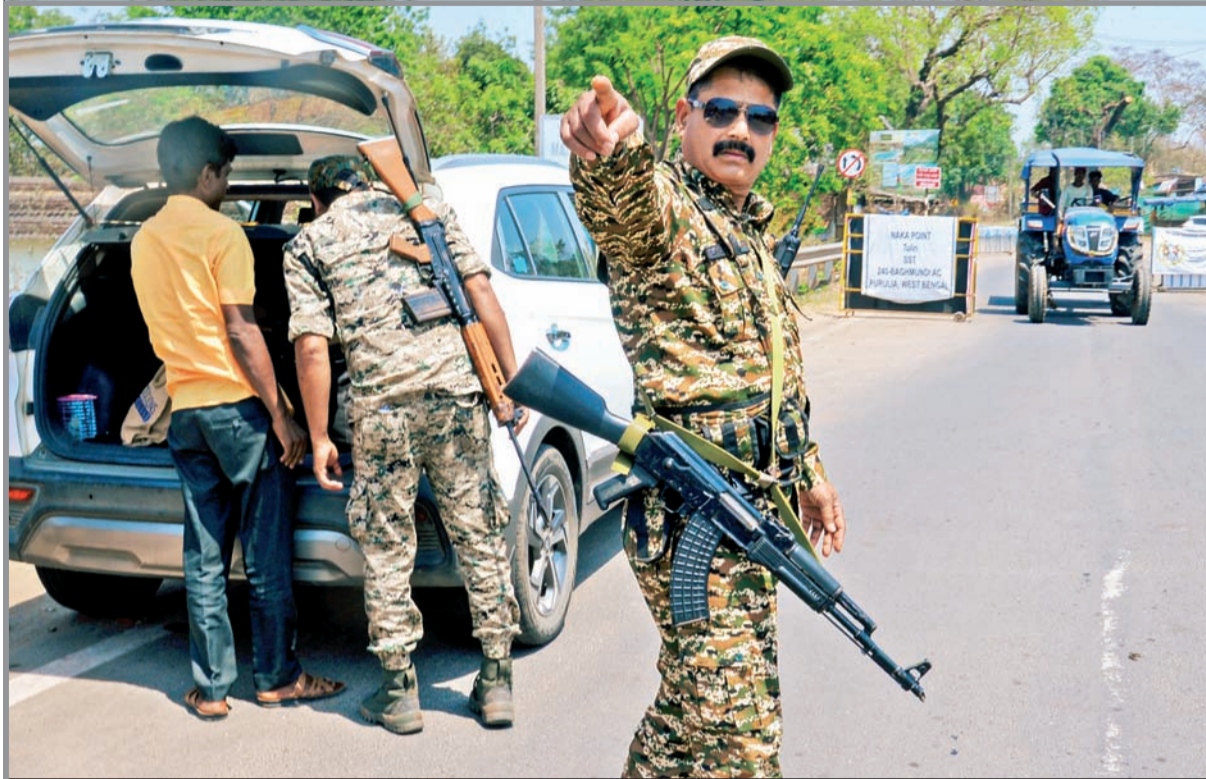
पश्चिम बंगालमधील विधानसभा निवडणुकांच्या पृष्ठभूमीवर सुरक्षा व्यवस्था कठोर करण्यात आली असताना झारखंडमधील रांची जिल्ह्याच्या तुलिन येथील आंतरराज्यीय सीमा तपासणी नाक्यावर एका वाहनाची तपासणी करताना सीआरपीएफ जवान