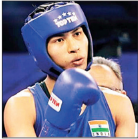
केवळ पदकांच्या शर्यतीमुळेच नव्हे, तर या स्पर्धेला आणखी विशेष महत्त्व प्राप्त झाले आहे. कारण बॉक्सिंग फेडरेशन ऑफ इंडियाच्या निवड धोरणानुसार या स्पर्धेच्या अंतिम फेरीत पोहोचणाऱ्या खेळाडूंना राष्ट्रकुल व आशियाई क्रीडा स्पर्धांसाठी थेट पात्रता मिळणार आहे.

ही स्पर्धा या अत्यंत व्यस्त हंगामातील पहिलीच मोठी आंतरराष्ट्रीय मोहीम आहे. या हंगामात ग्लासगो येथील राष्ट्रकुल क्रीडा स्पर्धा (जुलै-ऑगस्ट), जपानमधील ऐची-नागोया येथे होणाऱ्या आशियाई क्रीडा स्पर्धा (सप्टेंबर-ऑक्टोबर) आणि उडुकेबिस्तानमधील जागतिक मुष्टियुद्ध चषक अंतिम फेरीचा समावेश आहे. ◀(वृत्तसंस्था)