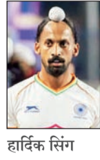
हार्दिक सिंग सलीमा टेदे

कामगिरीसाठी व जमन लाल शर्मा पुरस्कार (अमृत्य योगदानासाठी) यांसारखे विशेष सन्मानही प्रदान केले जाणार आहे. तसेच, वर्षातील सर्वोत्तम पंच/पंच व्यवस्थापक, वर्षातील सर्वोत्तम तांत्रिक अधिकारी आणि सर्वोत्तम सदस्य घटक या पुरस्कारांच्या माध्यमातून पदाधिकार्यांवाही गौरव केला जाईल. या समारंभात, आशिया चषकात सुवर्णपदक जिंकणाऱ्या भारतीय पुरुष संघाचा आणि विश्वचषकात कांस्यपदक पटकावणाऱ्या कनिष्ठ (ज्युनियर) पुरुष संघाचाही सत्कार करण्यात येईल. भारतीय हॉकीसाठी अत्यंत महत्त्वाच्या असलेल्या वर्षात आपण पदार्पण करत असताना, गत वर्षभरत केलेली उत्कृष्ट कामगिरी आणि दिलेल्या योगदानाची दखल घेणे महत्त्वाचे आहे. त्यांचे प्रयत्न आणि त्यांनी केलेली प्रगती यांचा गौरव करण्यास आम्ही उत्सुक आहोत, असे हॉकी इंडियाचे अध्यक्ष दिलीप तिर्की यांनी म्हटले.