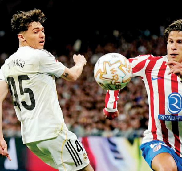
समर्थकांकडून विनिसियसला मिळणारा प्रतिसादही सुधारला आहे. सप्टेंबरमध्ये झालेल्या ५-२ च्या मानहानीकारक पराभवांनंतर

◆ बारसिलोना, २३ मार्च ला लीगा फुटबॉल स्पर्धेत आक्रमक खेळाडू विनिसियस ज्युनियरने नोंदविलेल्या महत्त्वपूर्ण दोन गोलच्या बळावर रियल माद्रिदने अॅटलेटिको माद्रिदवर ३-२ अशा एका गोलच्या फरकात रोमांचक विजय नोंदविला. या विजयाबरोबरच रियल माद्रिद संघ ला लीगा विजेतेपदाच्या शर्यतीत कायम राहिला. या मोसमाच्या सुरुवातीला प्रशिक्षक झाबी अलोन्सो यांना पदावरून दूर केण्यामुळे व काही लाजिरवाण्या पराभवांमुळे विनिसियसला माद्रिदच्या चाहत्यांच्या टोमण्यांना सामोरे जावे लागले होते. निकाल सुधारत