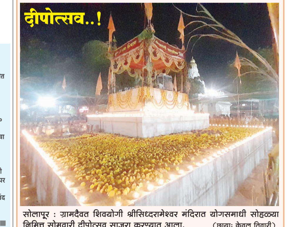
सोलापूर : ग्रामदैवत शिवयोगी श्रीसिध्दरामेश्वर मंदिरात योगसमाधी सोहळ्या निमित्त सोमवारी दीपोत्सव साजरा करण्यात आला.