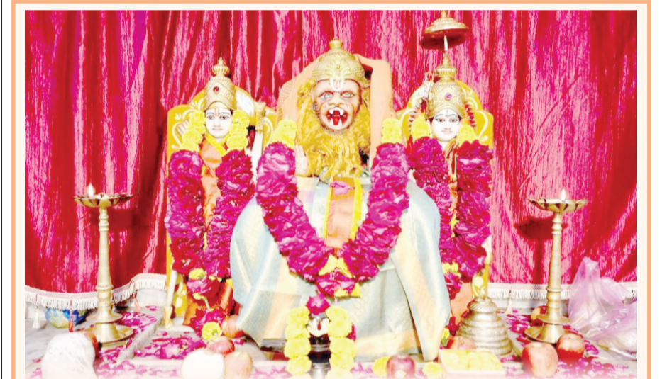
नरसिंह अवतार : पूर्व विभाग श्रीराम मंदिराच्या वतीने श्रीराम नवमीनिमित्त सोमवारी प्रभु श्रीरामास नरसिंह अवताराने अलंकृत करण्यात आले होते.