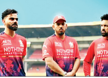
शिबिरात मार्गदर्शन करताना विराट कोहली

बंगळूर, २१ मार्च आपल्या विजेतेपदाचे रक्षण करण्यासाठी सज्ज होत असताना, संघाचा आधारस्तंभ असलेला धडाकेबाज फलंदाज विराट कोहलीने शनिवारी आपल्या सॅमल चॅलेंजर्स बंगळूर (आरसीबी) संघातील सहकाऱ्यांना पूर्णपणे सज्ज होण्याचे आणि सराव सत्रांमधील एकही मिनिट वाया न घालवण्याचे आवाहन केले. एम. चिन्नास्वामी स्टेडियमवर झालेल्या सराव सत्रादरम्यान संघाला संबोधित करताना, कोहलीने गत वर्षी संघाला विजेतेपद मिळवून देणारी तीच तीव्रता कायम राखण्याची गरज असल्याचे सांगितले. आपल्या आयपीएल २०२६ मोहिमेची सुरुवात २८ मार्च रोजी एम. चिन्नास्वामी स्टेडियमवर सनरायडर्स हैदराबाद विरुद्धच्या सामन्याने होणार आहे. गत वर्षी आम्ही जे यश संपादन केले, ते मिळवण्यासाठी आम्ही मागील दोन-तीन हंगामांमध्ये खूप मेहनत घेतली होती. आता हे आव्हान