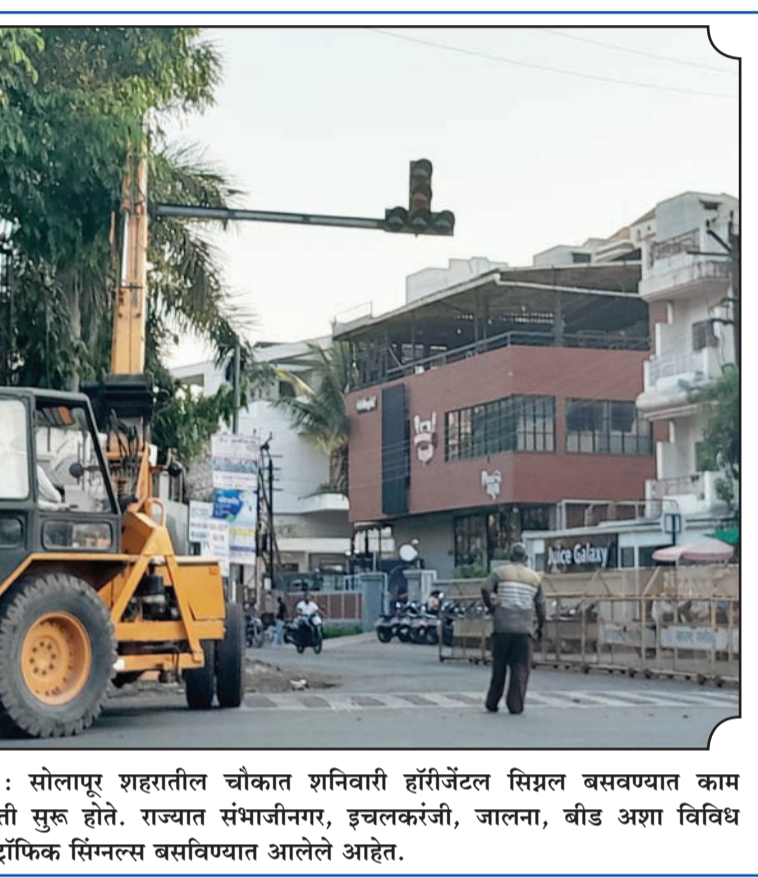
सोलापूर : सोलापूर शहरातील चौकात शनिवारी हॉरिजेंटल सिग्नल बसवण्यात काम युद्धपातळीवरती सुरु होते. राज्यात संभाजीनगर, इचलकरंजी, जालना, बीड अशा विविध शहरात असे ट्रॉफिक सिग्नल्स बसविण्यात आलेले आहेत.