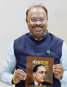
चंद्रशेखर बावनकुळे महसूल मंत्री