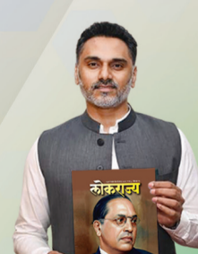
योगेश कदम महसूल राज्यमंत्री