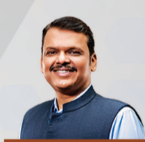
देवेंद्र फडणवीस मुख्यमंत्री