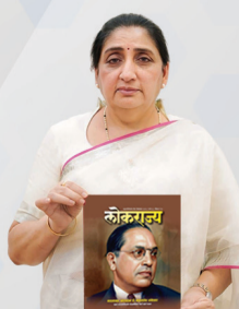
सुनेत्रा अजित पवार उपमुख्यमंत्री