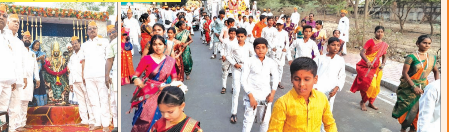
भावसार समाज कुलस्वामिनी हिंगुलाबिकादेवी प्रकट दिनानिमित्त मंगळवारी सायंकाळी सोलापूर शहरातील प्रमुख मार्गावरून शोभायात्रा काढण्यात आली.