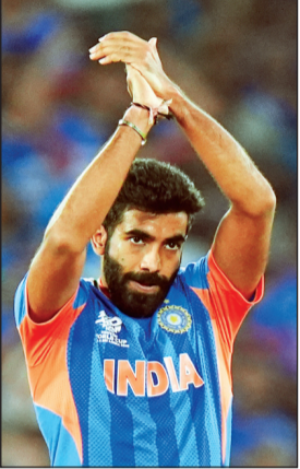
सामनावीर बुमराहचे १५ धावांत ४ बळी

अहमदाबाद, ८ मार्च आयसीसी पुरुषांच्या टी-२० विश्वचषक क्रिकेट स्पर्धेच्या अंतिम सामन्यात नरेंद्र मोदी स्टेडियमवर सुमारे ९० हजार प्रेक्षकांच्या उपस्थितीत सूर्यकुमार यादवच्या नेतृत्वाखालील भारतीय संघाने मिवेल सॅमसनच्या नेतृत्वाखालील न्यूझीलंड संघाचा ९६ धावांनी पराभव करून सलग दुसऱ्यांदा टी-२० विश्वचषक जिंकला.