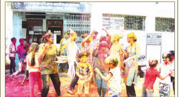
बाल सुधारगृहात मुर्लींनी उत्साहात रंगपंचमी साजरी केली