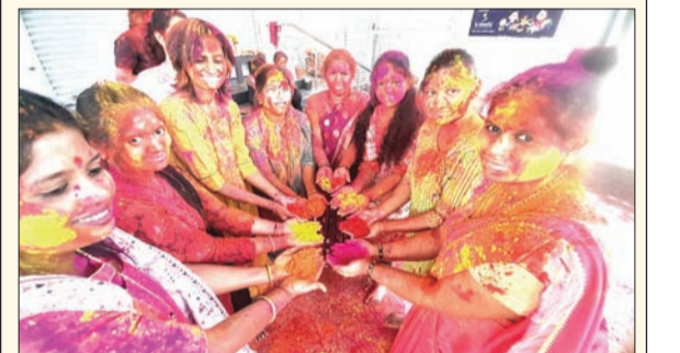
गोविंद सहकारी सोसायटी येथील महिलांची रंगपंचमी

नमो शेतकरी महामन्मान निधी : ज्या महिलांच्या नावावर शेती आहे, त्यांना केंद्र व राज्य सरकारकडून दरवर्षी १२,००० रुपये सन्मान निधी दिला जातो. यासोबतच लाडकी बहीण योजनेचा लाभही मिळतो.