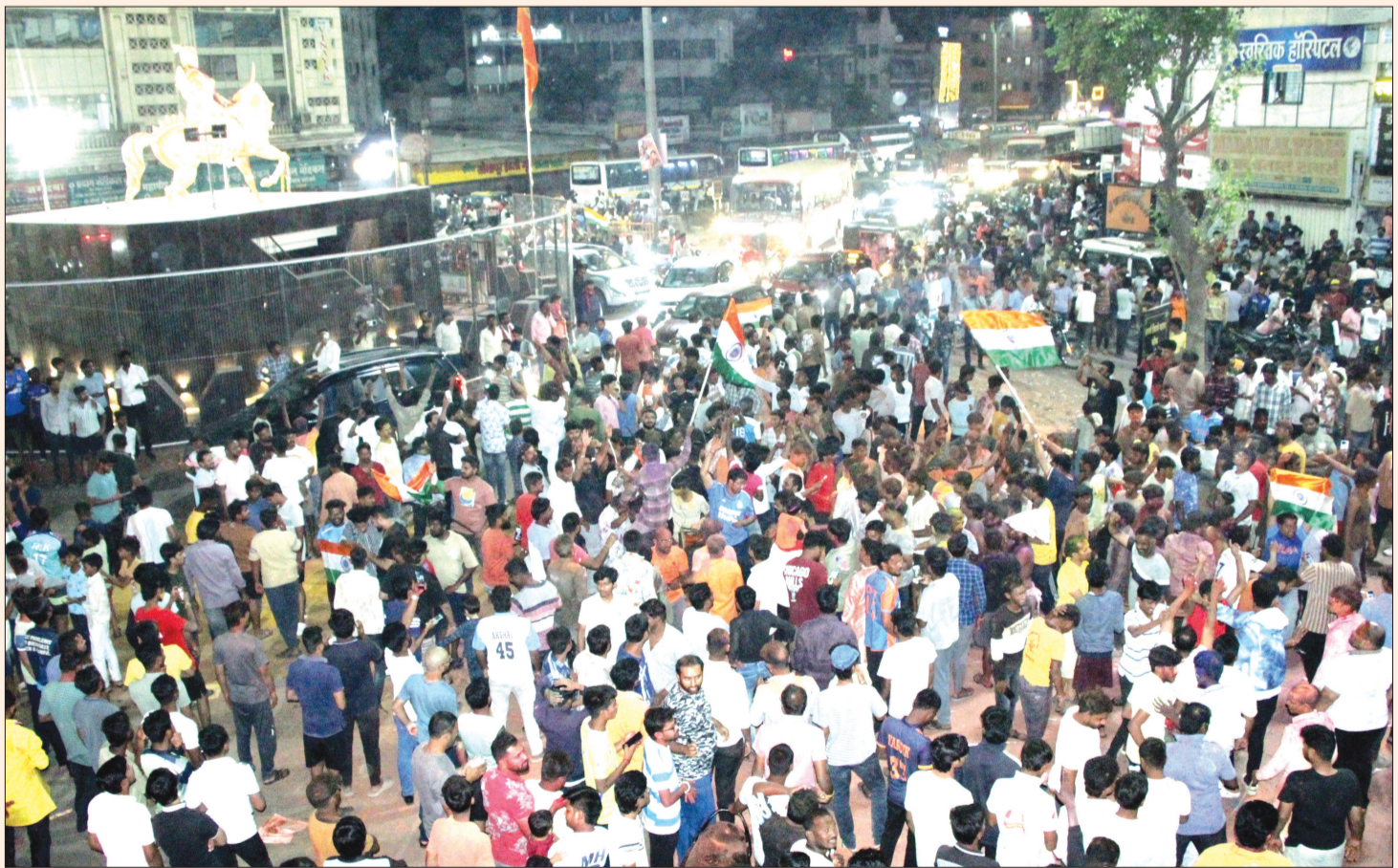
सोलापूर : टीम इंडियाने विजय मिळविल्यानंतर छत्रपती शिवाजी चौकात जल्लोष करतानाचा रविवारी रात्री टिपलेला क्षण.