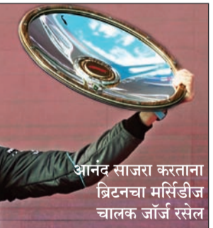
आनंद साजरा करताना ब्रिटनचा मर्सिडीज चालक जॉर्ज रसेल

जयपूर, ८ मार्च आयसीसी पुरुष टी-२० विश्वचषक आयत्या उच्च-स्तरीय क्रिकेटसाठी जगाचे लक्ष वेधून घेत, परंतु या स्पर्धेचे जयपूरशीही फारसे ज्ञात नसलेले नाते आहे. या जयपूरमध्ये आयकॉनिक विश्वचषक ट्रॉफी तयार करण्यात आली.