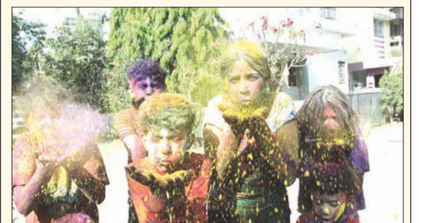
महेश नगर परिसरात बालगोपालाची रंगपंचमी.