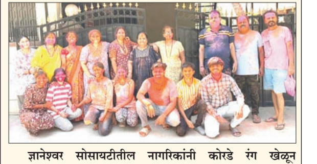
ज्ञानेश्वर सोसायटीतील नागरिकांनी कोरडे रंग खेळून रंगपंचमीचा आनंद लुटला.