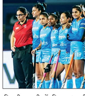
विजयी सलामी नोंदविणारा भारतीय महिला हॉकी संघ