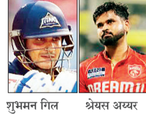
शुभमन गिल श्रेयस अय्यर

२०२३ पासून केवळ विराट कोहलीनेच गिलपेक्षा अधिक धावा केल्या आहेत; परंतु आता लक्ष सातत्यावरून स्ट्राइक रेटकडे वळले आहे. २० कारकिर्दीत सुमारे १३८ च्या स्ट्राइक रेट असलेल्या गिलने गत हंगामात सुधारणेची चिन्हे दर्शविली आहेत. फलंदाजी प्रशिक्षक मॅथ्यू हेडन यांचे गिलचे षटकार मारण्याचे कौशल्य व त्याच्या आक्रमक शैलीवर बारकाईने लक्ष असेल. २०२३ नंतर हार्दिक पांड्या संघातून बाहेर पडल्यापासून, गिलने कर्णधारपदाची जबाबदारी समर्थपणे पेलली आहे व आता संपूर्ण संघ स्पर्धेतील त्याच्याच भोवती फिरताना दिसत आहे. २०२२ मध्ये आपल्या