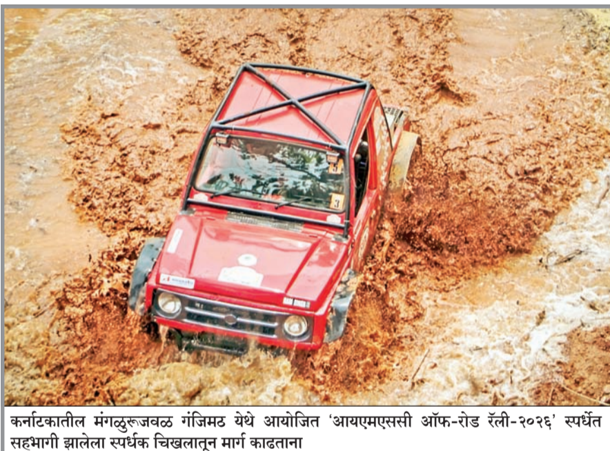
कनटकातील मंगळूरुजवळ गंजिमठ येथे आयोजित 'आयएमएससी ऑफ-रोड रॅली-२०२६' स्पर्धेत सहभागी झालेला स्पर्धक चिखलातून मार्ग काढताना

गर्दी टाळण्यासाठी परिवहन विभागाने ऑनलाईन अर्ज करण्याची सुविधाही दिली आहे. वाहन मालक अधिकृत संकेतस्थळावर जाऊन आवश्यक कागदपत्रे अपलोड करू शकतात. यानंतर केंद्रांवर जाऊन प्रत्यक्ष पडताळणी करून कार्ड मिळवू शकतात. ■