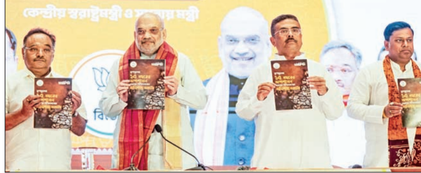
बंगालमधील तृणमूल काँग्रेस सरकार विरोधातील आरोपपत्र नागरिकांसमोर सादर करताना अमित शाह

राज्य सरकार सीमा सुरक्षा मजबूत करण्याच्या प्रयत्नांमध्ये