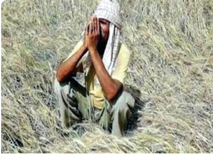
पूर्वी ग्रामीण भागात सालगडी सहज बैल बारदाणा परवडत असत परंतु उपलब्ध होत असत. म्हणून शेतकऱ्यांना सध्या आधुनिक तंत्रज्ञानाचा अवलंब

शेतीकामासाठी कायमस्वरूपी मजूर मिळणे दिवसेंदिवस कठीण होत चालल्याने तालुक्यातील अनेक शेतकरी सध्या सालगड्यांच्या शोधात गावोगा-वी फिरताना दिसत आहेत. सालगडी मिळत नसल्याने त्यांची मागणी मोठ्या प्रमाणात वाढली असून त्यांच्या पगारानेही आता दीड ते पाचवे दोन लाख रुपयांचा टप्पा गाठला आहे.