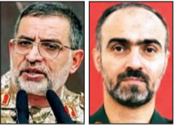
अली नाईनी अहमदी

ब्रिगेडियर जनरल अली मोहम्मद नाईनी हे आयआरजीसीचे प्रवक्ते आणि जनसंपर्क विभागाचे उपप्रमुख होते. जुलै २०२४ मध्ये आयआरजीसीचे सरसेनापती हुसेन सलामी यांनी त्यांची या पदावर