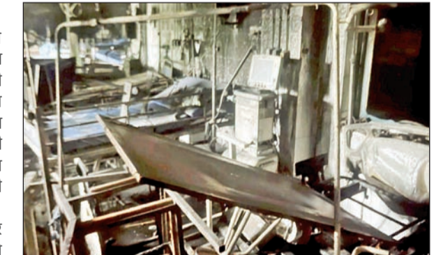
आग लागल्यानंतर अतिदक्षता विभागाची झालेली अवस्था

रुग्णालयाच्या ट्रॉमा केअर विभागाच्या अति दक्षता विभागामध्ये आग लागली आणि ती वेगाने वाढत गेली. गंधीर स्थितीत असलेल्या रुग्णांवर तेथे उपचार सुरू होते. आगीची माहिती मिळताच अग्निशमन दलाची पथके तातडीने रुग्णालयात दाखल झाली. अग्निशमन दलाच्या जवानांनी कारवाई सुरू केली आणि आग आटोक्यात आणली, असे एका अधिकाऱ्याने सांगितले. रुग्णांना सुरक्षितपणे बाहेर काढण्याच्या प्रयत्नात रुग्णालयातील अकरा कर्मचारीही भाजले. एकूण २३ रुग्णांना तातडीने इतर विभाग आणि वॉर्डमध्ये हलवण्यात आले. रुग्णालयातील कर्मचारी, पोलिस आणि रुग्णांसोबत असलेल्या लोकांनीही या बचाव कार्यात मदत केली. घटनेची माहिती मिळताच,